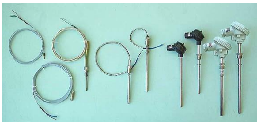
Рисунок 6 – Преобразователи погружаемые общепромышленные ТХА 002-Оп, ТХК 002-Оп и взрывозащищенные ТХА 002-Ехi, ТХК 002-Ехi с диаметром защитной арматуры до 10 мм включительно