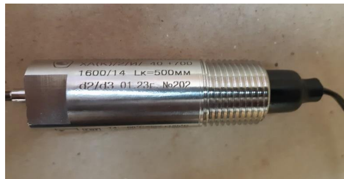
Рисунок 10 – Место нанесения заводского номера методом лазерной гравировки на корпус преобразователя