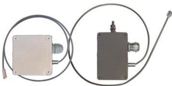
Рисунок 4 – Преобразователи поверхностные общепромышленные ТХА 002.П-Оп, ТХК 002.П-Оп и взрывозащищенные ТХА 002.П-Ехi, ТХК 002.П-Ехi