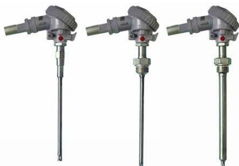
Рисунок 2 – Преобразователи взрывозащищенные ТХА 001-Ехd