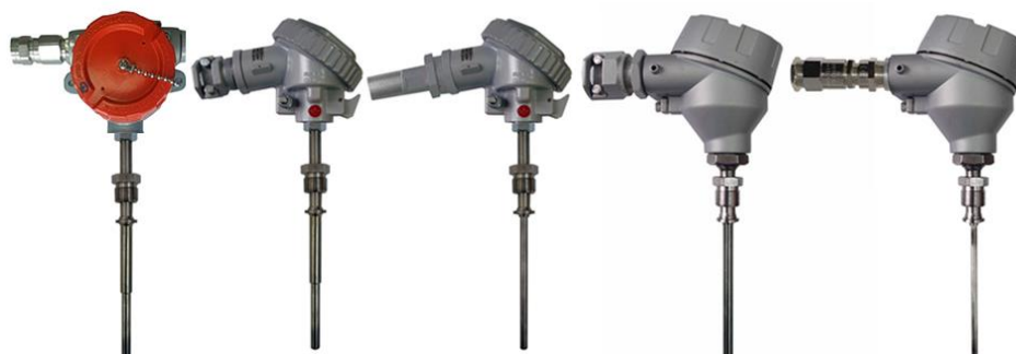
Рисунок 8 – Преобразователи погружаемые взрывозащищенные ТХА 002-Ехd, ТХК 002-Ехd