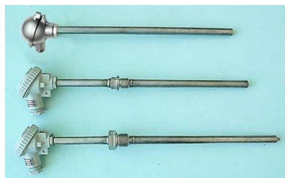
Рисунок 3 – Преобразователи погружаемые общепромышленные ТХА 002-Оп, ТХК 002-Оп и взрывозащищенные ТХА 002-Ехi, ТХК 002-Ехi-с диаметром защитной арматуры 20 мм