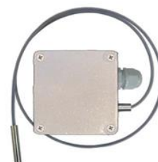
Рисунок 7 – Преобразователи погружаемые кабельные общепромышленные ТХА 002.К-Оп, ТХК 002.К-Оп и взрывозащищенные ТХА 002.К-Ехi, ТХК 002.К-Ехi с диаметром защитной арматуры до 10 мм включительно