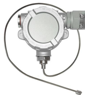
Рисунок 5 – Преобразователи поверхностные взрывозащищенные ТХА 002.П-Ехd, ТХК 002.П-Ехd