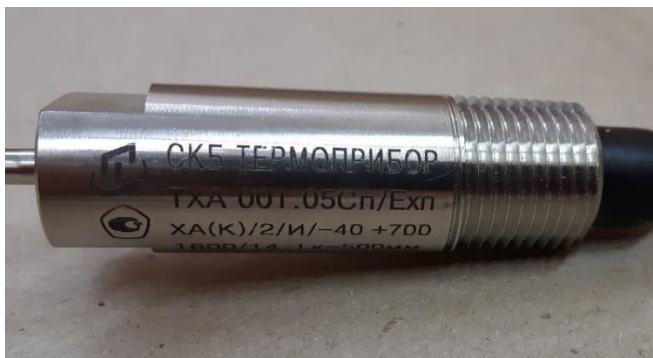
Рисунок 9 – Место нанесения знака утверждения типа методом лазерной гравировки на корпус преобразователя