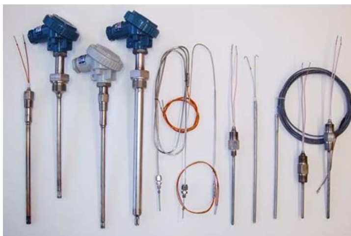
Рисунок 1 – Преобразователи общепромышленные ТХА 001-Оп и взрывозащищенные ХА 001-Ехi и ТХА 001-Ехп

Заводские номера в виде цифрового обозначения методом термотрансферной печати наносятся на этикетку (шильдик), прикрепленную к преобразователям, или методом лазерной гравировки на элементы конструкции преобразователя. Пломбирование преобразователей не предусмотрено.