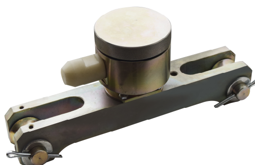
Рисунок 3 – Общий вид датчика нагрузки ДН-130(Р)

Пломбирование датчиков нагрузки ДН-130, ДН-130(А), ДН-130(Р) не предусмотрено. Знак поверки наносится на свидетельство о поверке.