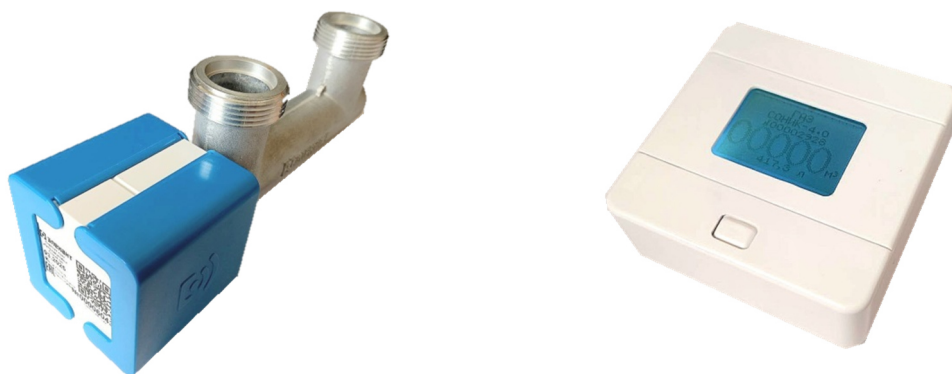
а) б) а) – Счетчик газа ультразвуковой СОНИК б) – Выносной индикатор