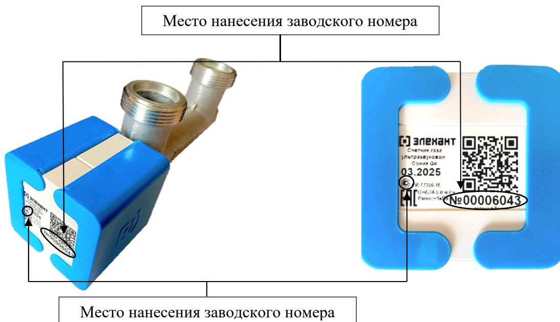
Р и с у н о к 2 – Места нанесения заводского номера и знака утверждения типа