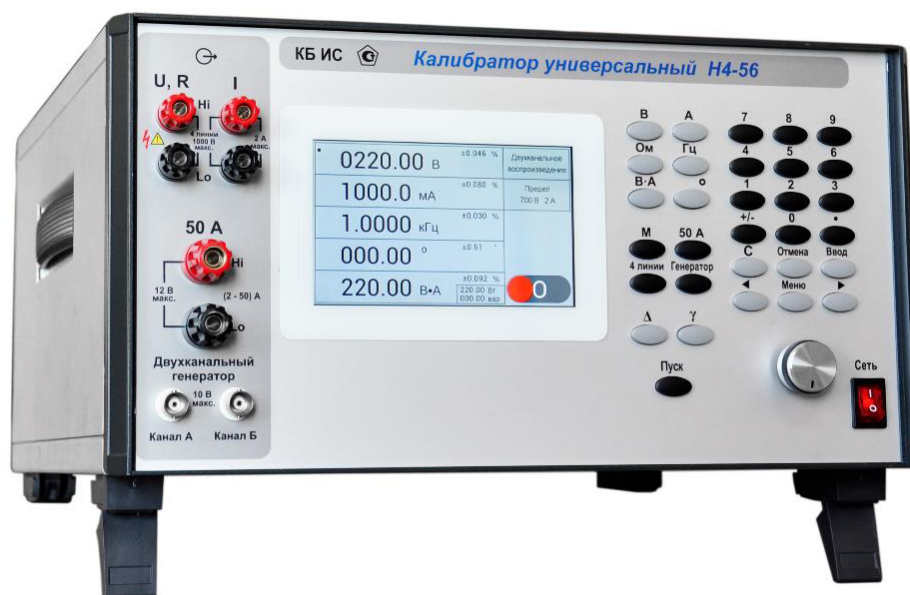
Рисунок 1 – Общий вид калибратора универсального H4-56

Фотография калибратора с указанием места нанесения заводского номера, представлена на рисунке 4.