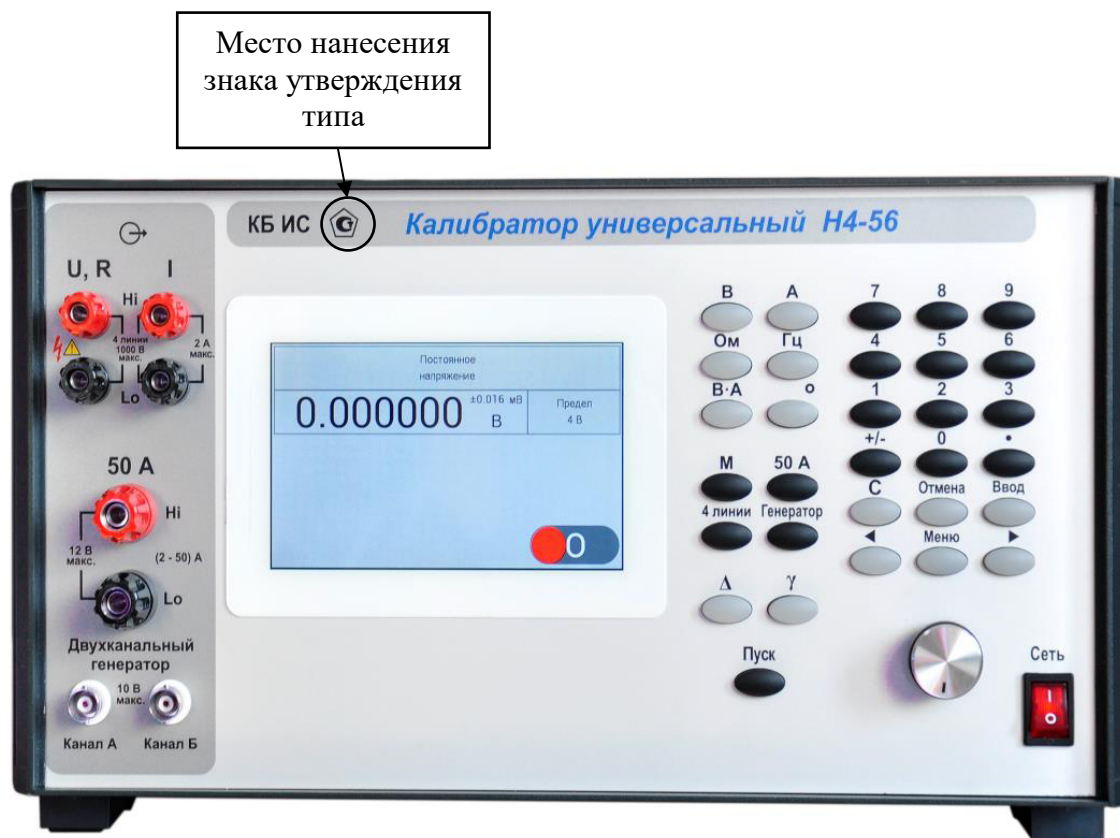
Рисунок 3 – Фотография калибратора с указанием места нанесения знака утверждения типа