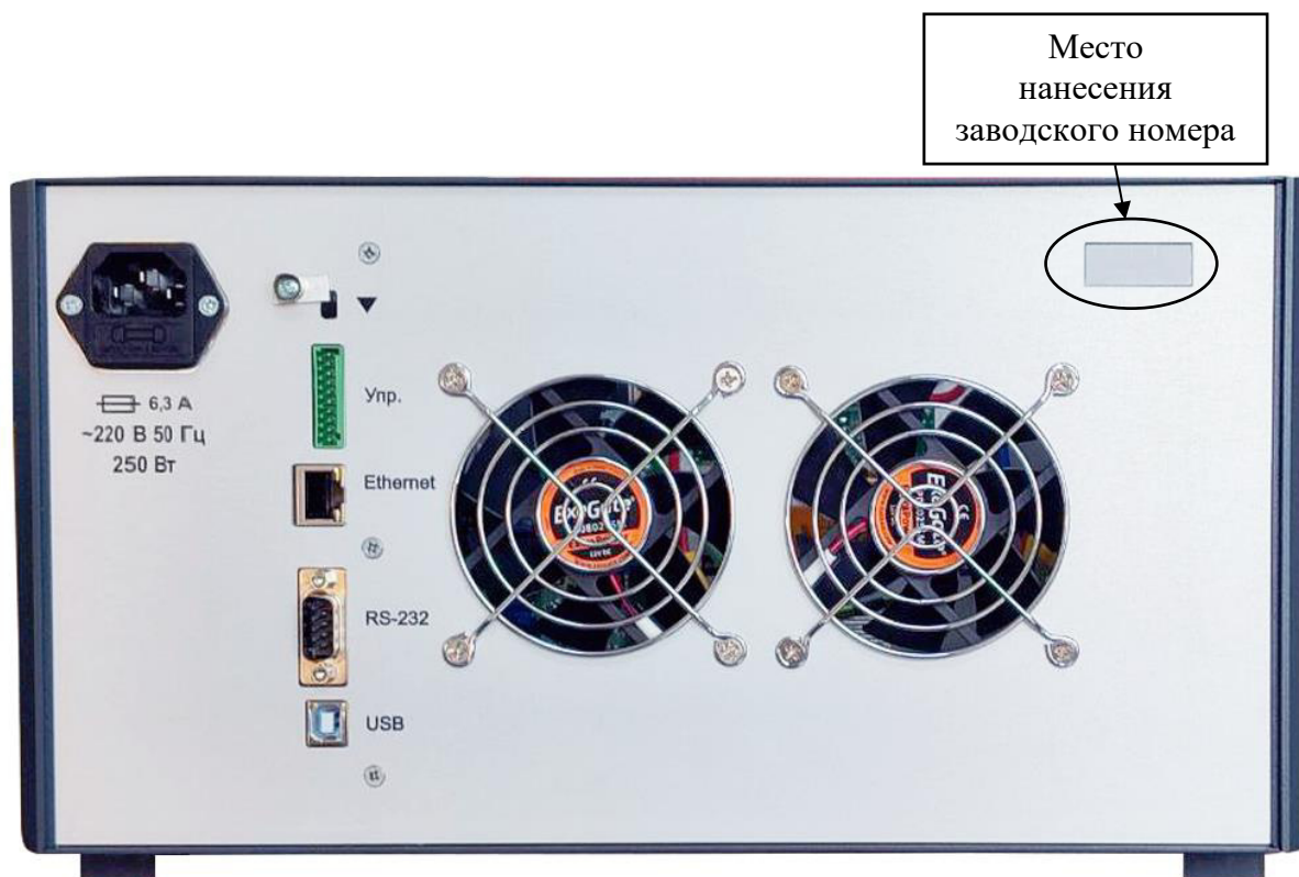
Рисунок 4 – Фотография калибратора с указанием места нанесения заводского номера