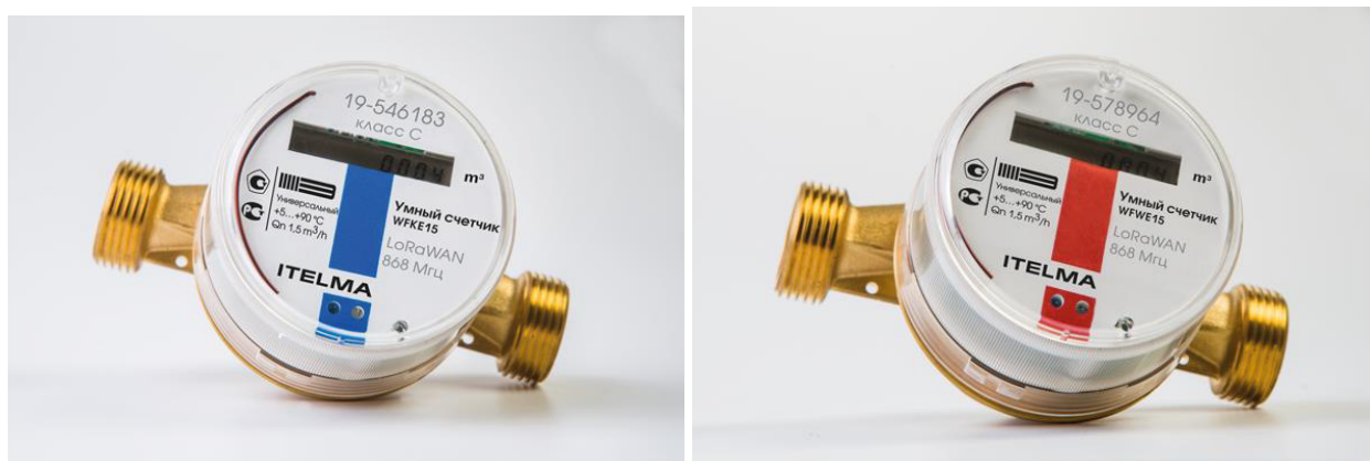
Рисунок 1 – Общий вид счетчиков воды электронных WFKE, WFWE

Защита от несанкционированного доступа счетчиков воды электронных WFKE, WFWE обеспечивается неразборной конструкцией счетного преобразователя, в которой прозрачная крышка счетного механизма запрессовывается на корпус измерительной камеры и не может быть снята без разрушения.