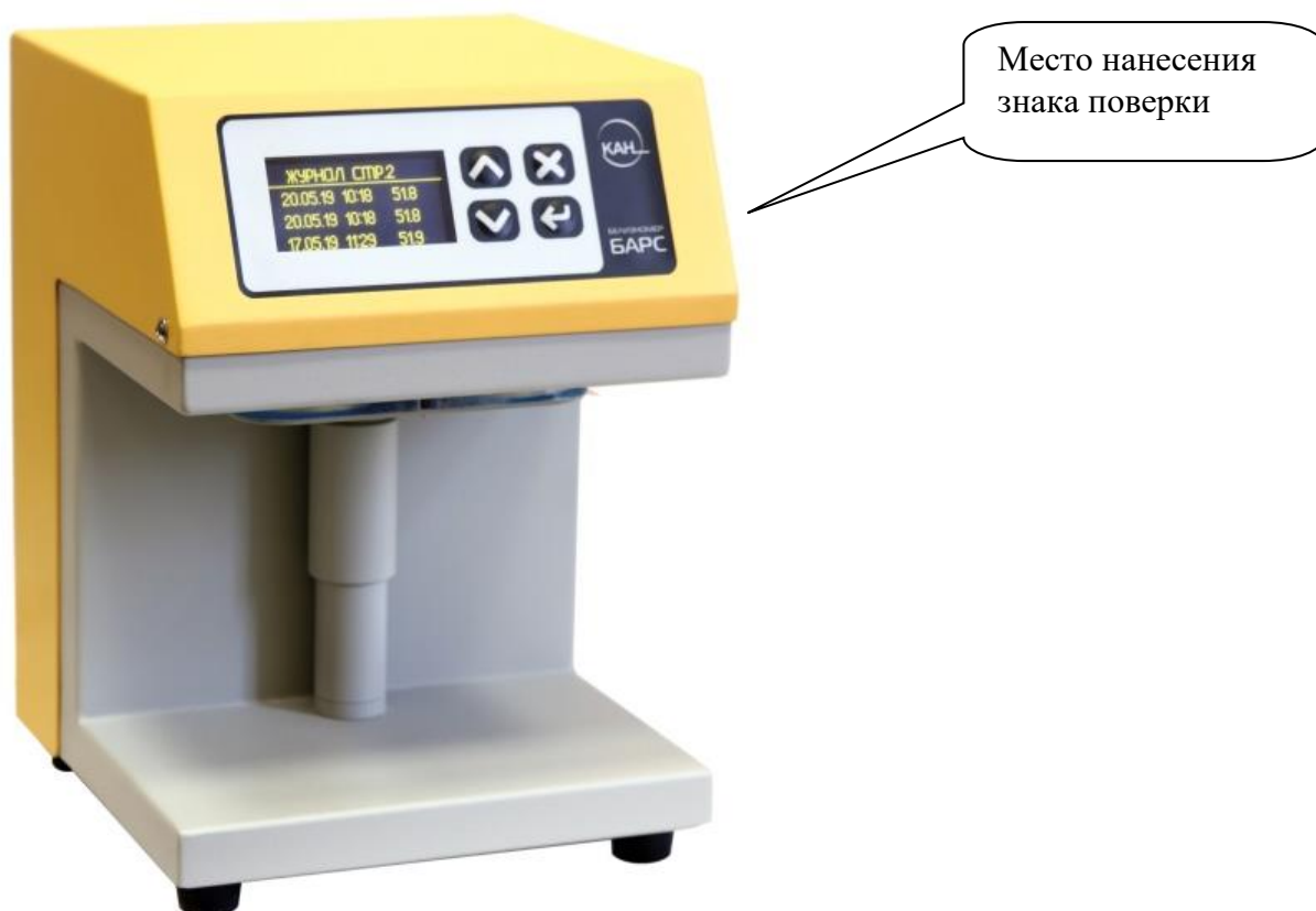
Рисунок 1 – Общий вид белизномера