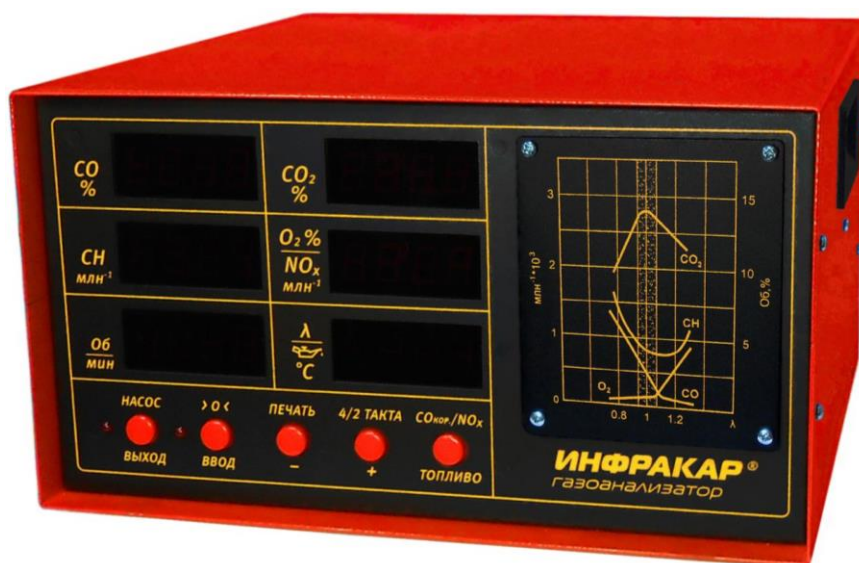
Рисунок 1 – Общий вид газоанализаторов ИНФРАКАР без принтера (вид спереди)