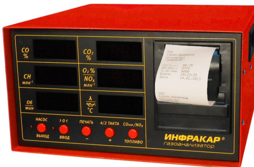
Рисунок 3 – Общий вид газоанализаторов ИНФРАКАР с принтером (вид спереди)