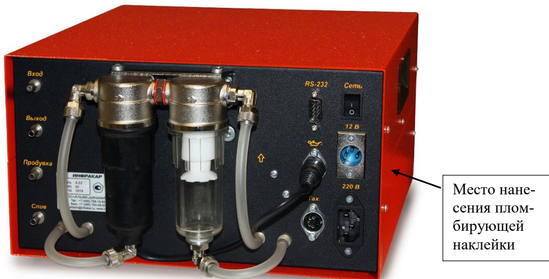
Рисунок 7 – Общий вид газоанализаторов ИНФРАКАР А и газоанализаторов с индексом «Л» в наименовании модификации (вид сзади)