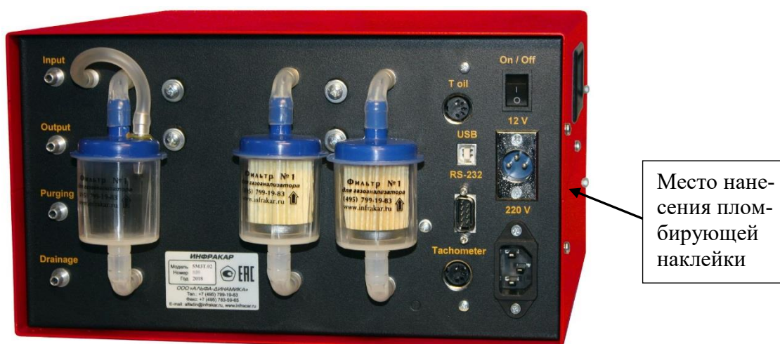
Рисунок 10 – Общий вид газоанализаторов ИНФРАКАР в экспортном исполнении (вид сзади)