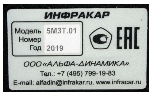
Рисунок 11 – Общий вид типовой идентификационной таблички и место нанесения знака утверждения типа для газоанализаторов производства ООО «Альфа-динамика»