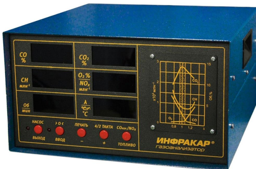
Рисунок 2 – Общий вид газоанализаторов ИНФРАКАР без принтера (в синем цвете; вид спереди)