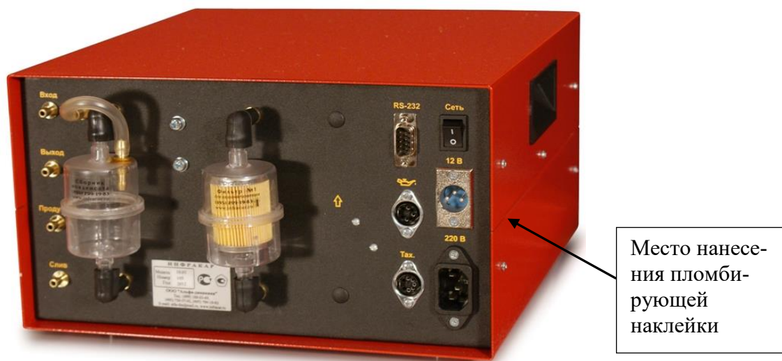
Рисунок 5 – Общий вид газоанализаторов ИНФРАКАР с одним фильтром (вид сзади)