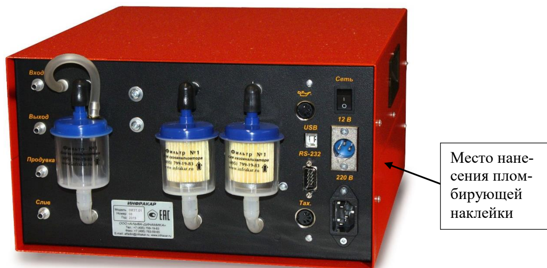
Рисунок 9 – Общий вид газоанализаторов ИНФРАКАР с дополнительным USB разъемом (вид сзади)