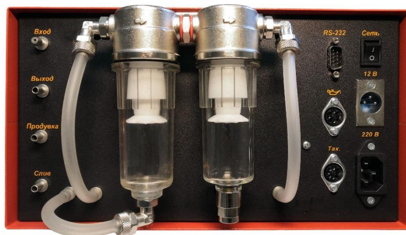
Рисунок 8 – Общий вид газоанализаторов ИНФРАКАР с индексом «Ф» в наименовании модификации (вид сзади)