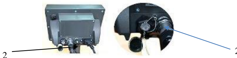
ТИТАН 3ЦС, ТИТАН 3Ц, ТИТАН 9/ТИТАН 9п, ТИТАН 12, 12С, ТИТАН Н22С