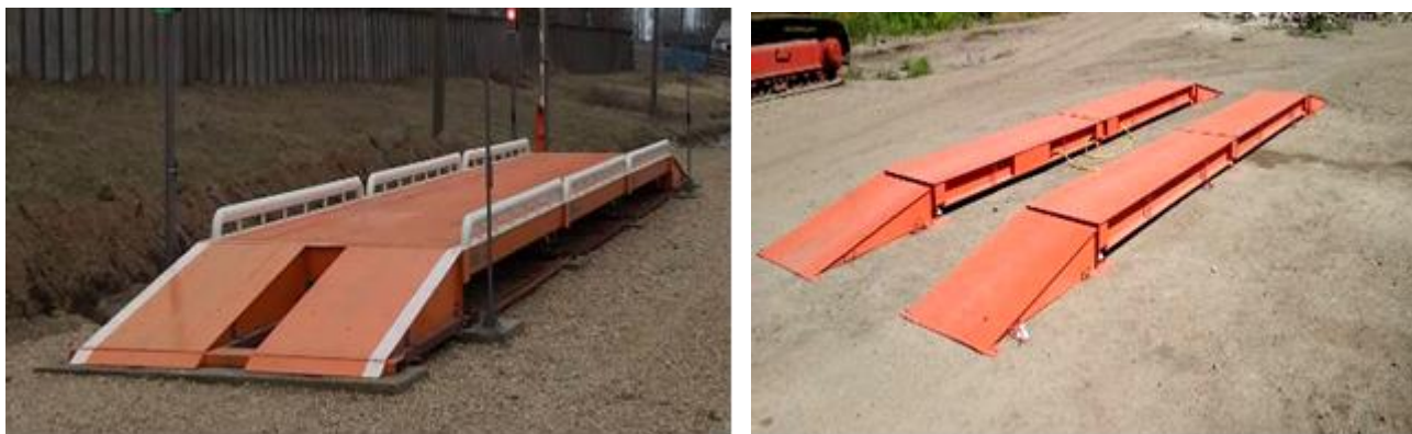
Рисунок 1 – Общий вид ГПУ весов (примеры)

Модификации весов имеют обозначения вида ВЕСТА-[1]-[2]-[3]-[4]. Расшифровка индексов в обозначении модификаций приведена в таблице 1.