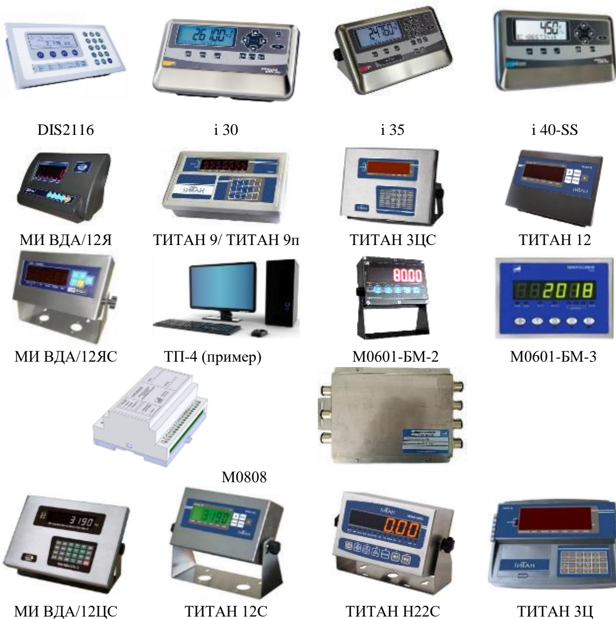
Рисунок 2 – Общий вид приборов весоизмерительных

Общий вид приборов весоизмерительных представлен на рисунке 2.