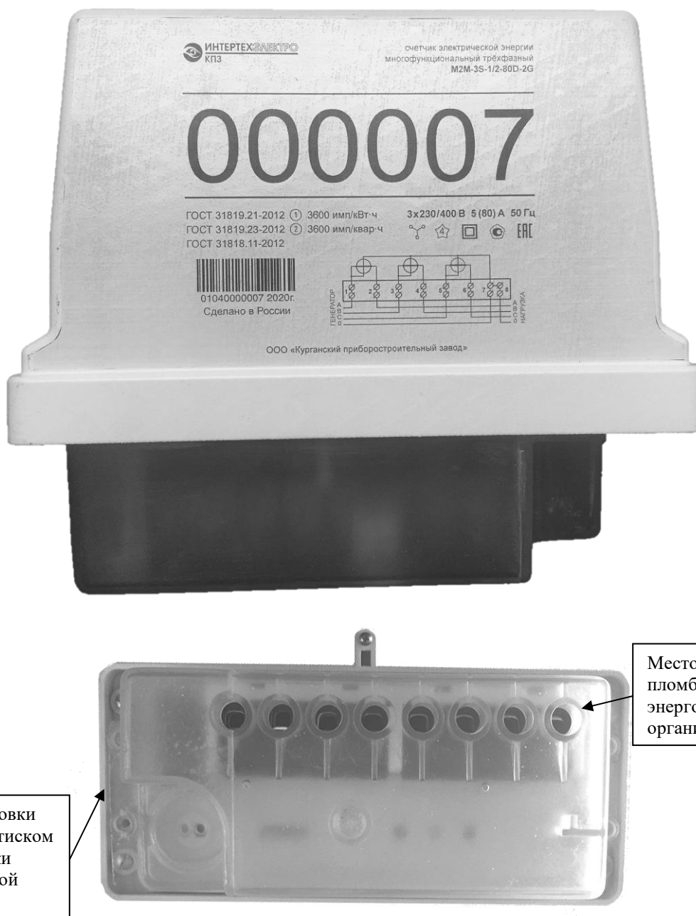
Рисунок 2 – Общий вид счетчиков M2M-3S и схема пломбировки от несанкционированного доступа