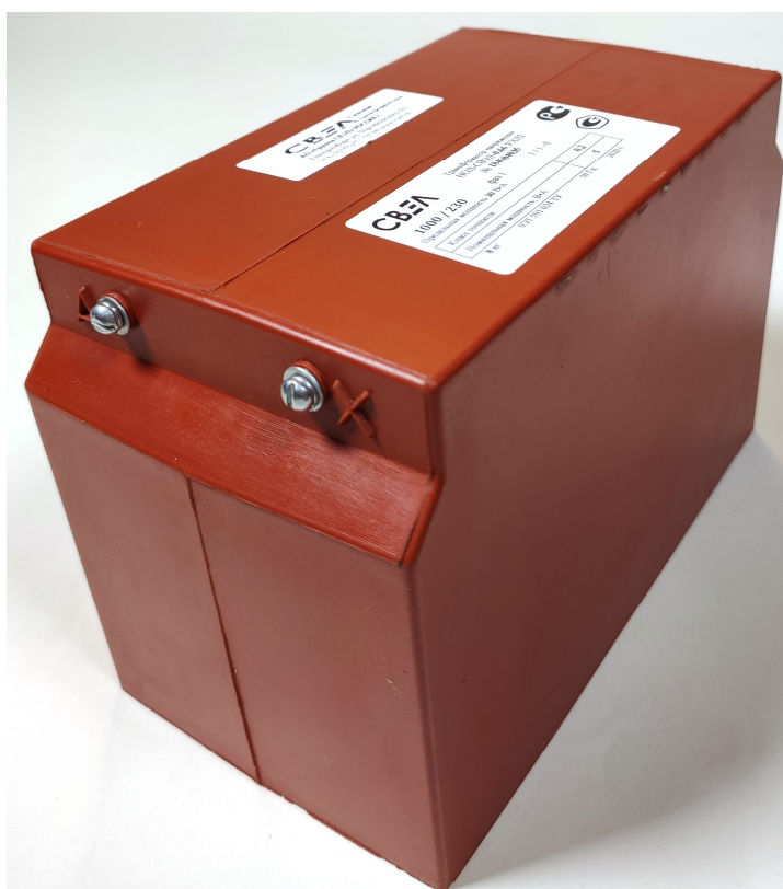
Рисунок 4 – Общий вид трансформаторов напряжения НОЛ-СВЭЛ-0,66. Вид со стороны первичной обмотки