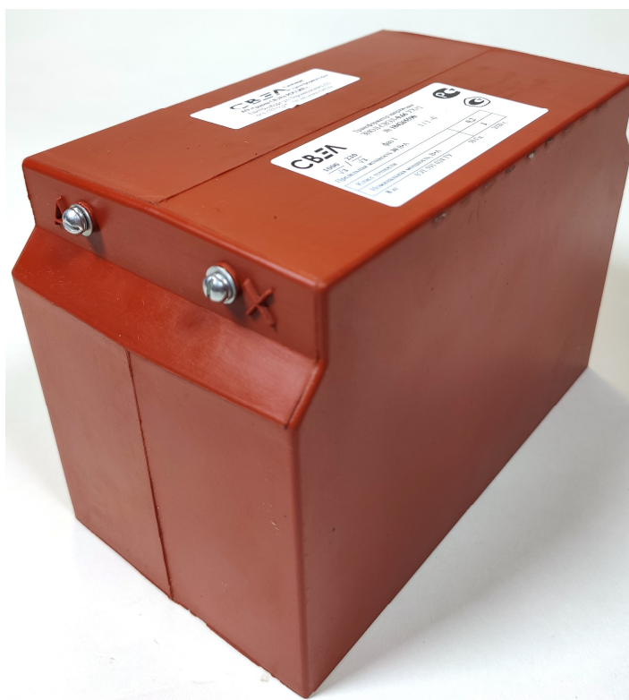
Рисунок 2 – Общий вид трансформаторов напряжения ЗНОЛ-СВЭЛ-0,66. Вид со стороны первичной обмотки