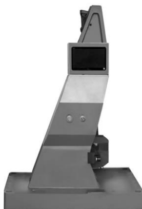
Рисунок 5 – Общий вид копров маятниковых ГОСТ серии МИК модификации МИК-150 (300; 450; 750; 900). 2-2.2.V

Для ограничения доступа в целях несанкционированной настройки и вмешательства производится опломбирование посредством нанесения специальной наклейки на корпус испытательной машины и нанесением специальной краски на винт механической защелки, регулировочный контргруз.