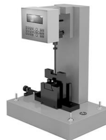
Рисунок 2 – Общий вид копров маятниковых ГОСТ серии МИК модификации МИК-50 (5,5; 25). Y-2.K.V