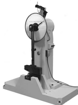
Рисунок 4 – Общий вид копров маятниковых ГОСТ серии МИК модификации МИК-150 (300; 450; 750; 900). 2-1.1.V