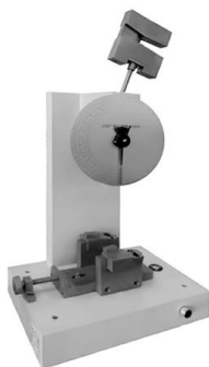
Рисунок 1 – Общий вид копров маятниковых ГОСТ серии МИК модификации МИК-50 (5,5; 25). Y-1.K.V

Общий вид копров маятниковых ГОСТ серии МИК показан на рисунках 1-5