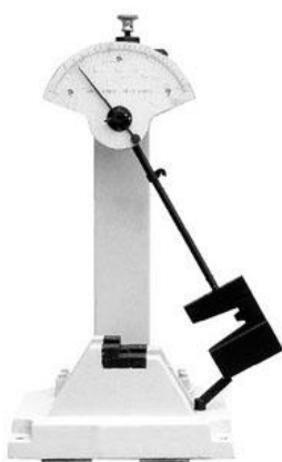
Рисунок 3 – Общий вид копров маятниковых ГОСТ серии МИК модификации МИК-150 (300; 450). Y-1.K.V