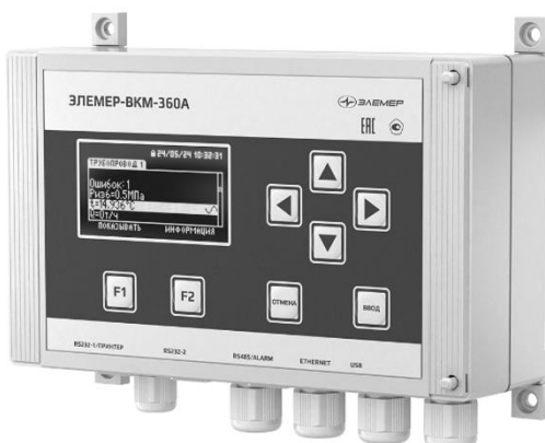
Рисунок 5 – Общий вид вычислителей расхода универсальных модификации «ЭЛЕМЕР-ВКМ-360А»