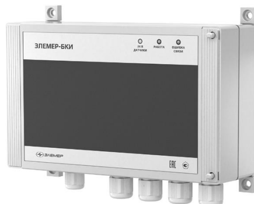
б) Блок «ЭЛЕМЕР-БКИ»