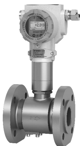
ЭЛЕМЕР-РВ (тип присоединения к процессу «фланцевый»)