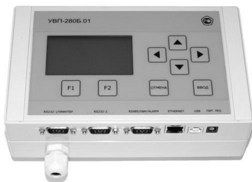
а) Блок вычислений