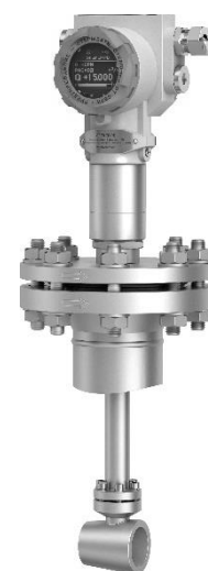
ЭЛЕМЕР-РВ (тип присоединения к процессу «зондо- вый»)