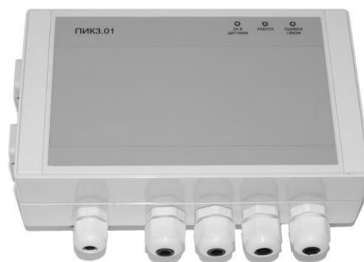
б) Блок ПИК3.01