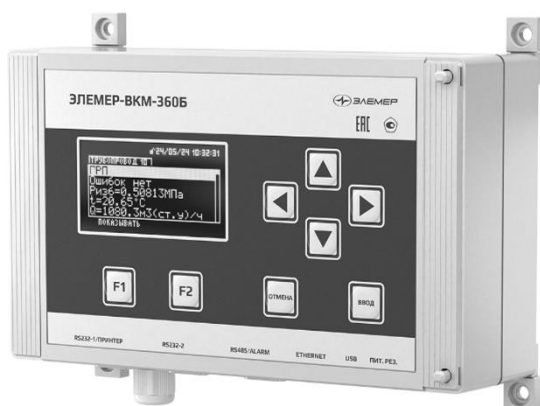
а) Блок вычислений БВ