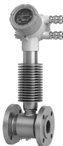
ЭЛЕМЕР-РВ (тип присоединения к процессу «фланцевый», высокотемпературный)