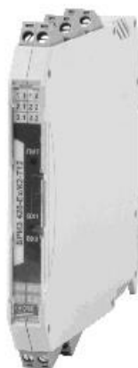
Рисунок 9 – Общий вид барьеров искрозащиты «БРИЗ»

Места нанесения пломб для защиты от несанкционированного доступа приведены в описаниях типа вычислителей и первичных преобразователей в составе счетчиков.