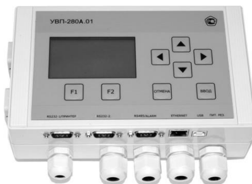
Рисунок 7 – Общий вид вычислителей УВП-280А.01