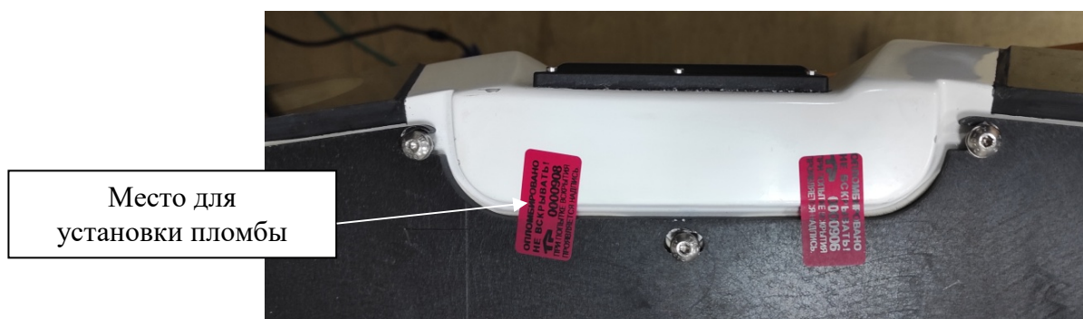
Рисунок 4 – Схема пломбировки от несанкционированного доступа на нижней поверхности видеомодуля