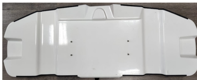
Место нанесения знака утверждения типа и заводского номера