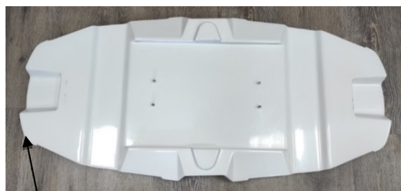
Место нанесения знака утверждения типа и заводского номера