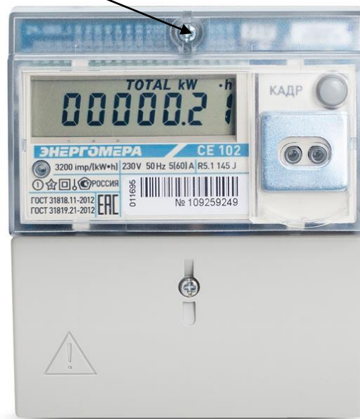
в) счетчик в исполнении корпуса R5.1