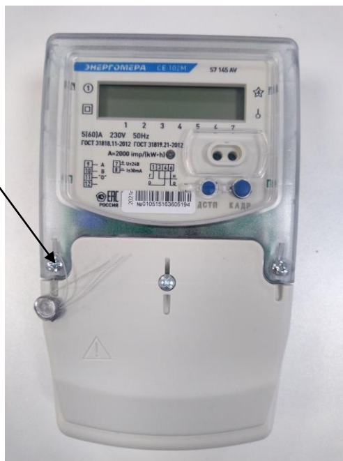
а) счетчик в исполнении корпуса S7