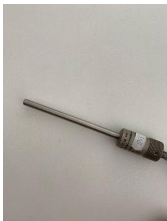
Рисунок 5 – Датчик температуры ДТМ исполнение ДТМ-П (Код исполнения ТТ.01.ДДД)