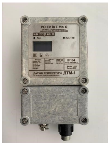
Рисунок 1 – Датчик температуры ДТМ исполнение ДТМ-1