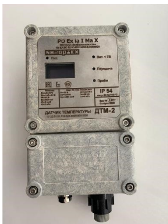
Рисунок 2 – Датчик температуры ДТМ исполнение ДТМ-2