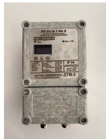
Рисунок 3 – Датчик температуры ДТМ исполнение ДТМ-3