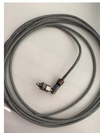
Рисунок 6 – Датчик температуры ДТМ исполнение ДТМ-П (Код исполнения ТТ.02.ДДД)