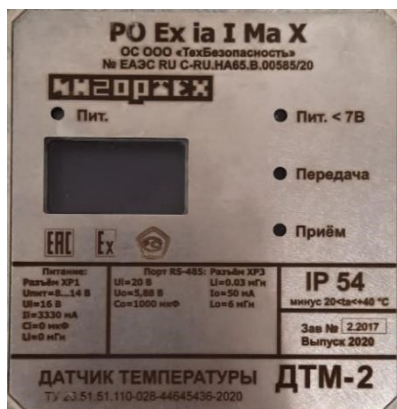
Рисунок 7 – Идентификационная табличка на корпусе датчиков