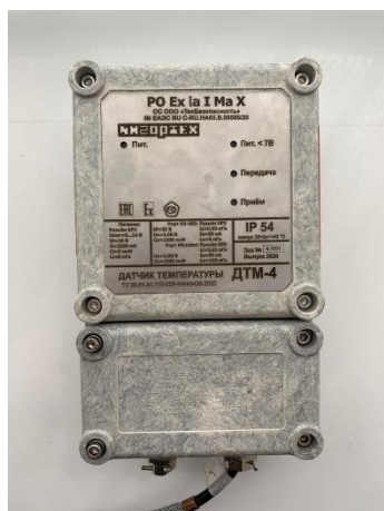
Рисунок 4 – Датчик температуры ДТМ исполнение ДТМ-4