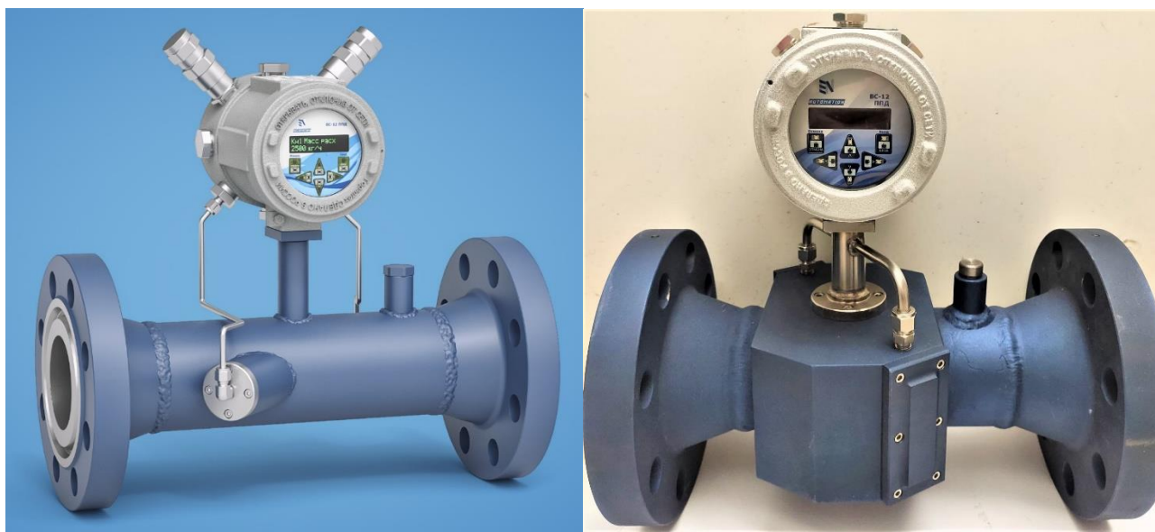
Рисунок 1 – Общий вид расходомеров-счетчиков «ВС-12 ППД»

Общий вид расходомеров-счетчиков «ВС-12 ППД» представлен на рисунке 1.