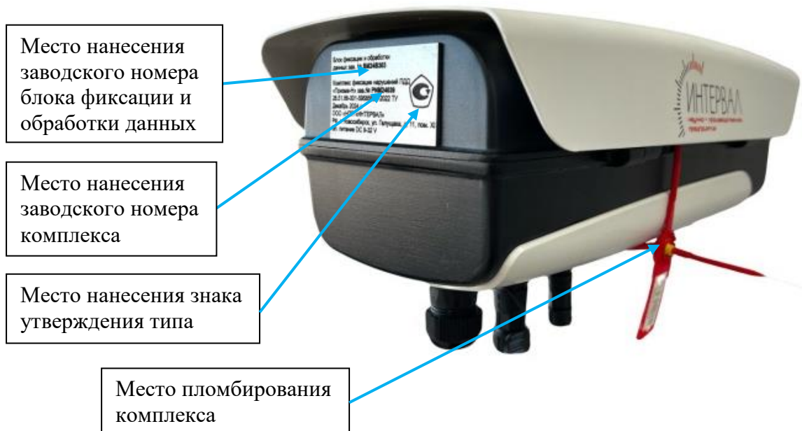
Рисунок 2 – Место пломбирования от несанкционированного доступа, место нанесения знака утверждения типа и заводских номеров комплексов и блоков фиксации и обработки данных