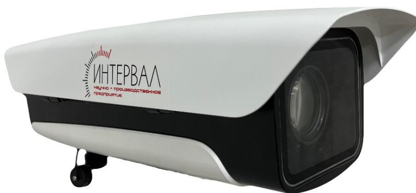
а) Блок фиксации и обработки данных

Общий вид составных частей комплексов с указанием места пломбирования от несанкционированного доступа, места нанесения знака утверждения типа и заводских номеров комплексов и блоков фиксации и обработки данных приведен на рисунках 1 и 2. Пример маркировки, наносимой на шильд, приведен на рисунке 3.