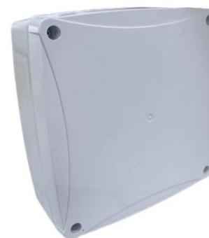
б) Радиолокационный модуль