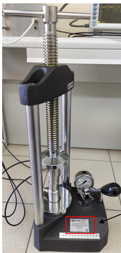
Рисунок 2 – Место расположения заводского номера