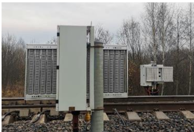
Рисунок 1 – Общий вид напольного оборудования модуля «Техновизор»

Общий вид напольного оборудования модуля «Техновизор» представлен на рисунках 1, 2.