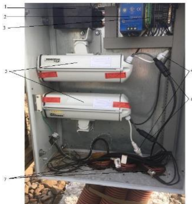
Рисунок 3 – Общий вид открытого шкафа напольного оборудования с фотокамерами и коммутационными линиями модуля «Техновизор»

Общий вид шкафа напольного оборудования представлен на рисунке 3-5.