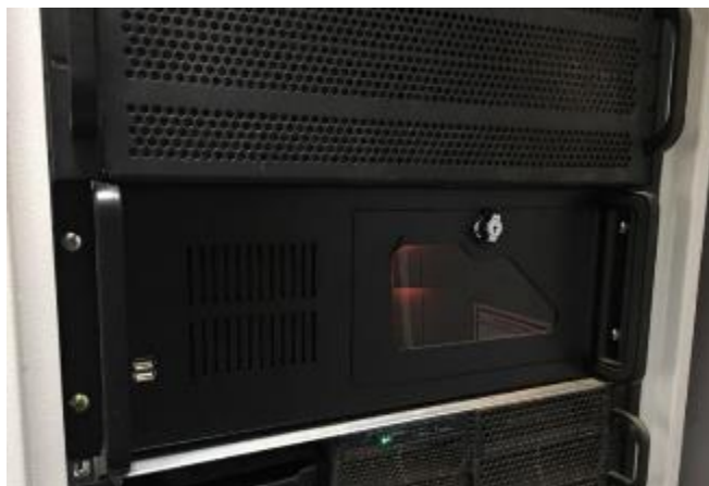
Рисунок 6 – Общий вид постового оборудования модуля «Техновизор»

Пломбирование блока обработки данных не предусмотрено.