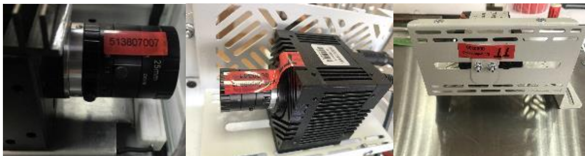
Рисунок 10 – Пример пломбировки фотокамеры «Техновизор», с объективом в сборе

При установке фотокамеры на месте эксплуатации определяются фактические расстояния от фотокамеры до объекта измерений, которые заносят в файл конфигурации модуля «Техновизор» и используют для формирования измерительного канала.