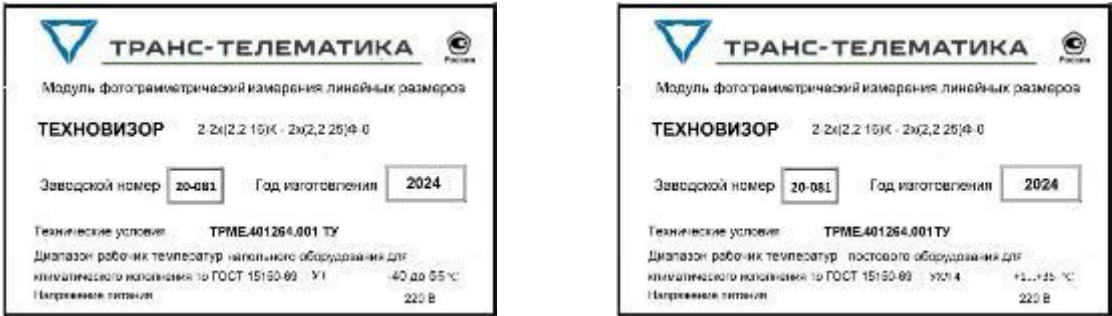
Рисунок 7 – Примеры маркировочных табличек напольного и постового оборудования модуля «Техновизор»

Модуль «Техновизор» имеет маркировочную табличку напольного оборудования, расположенную на корпусе шкафа, маркировочную табличку постового оборудования, расположенную на корпусе блока обработки данных, маркировочную табличку фотокамеры, расположенную на корпусе термокожуха или конструктива фотокамеры и полную маркировочную табличку, выводимую на экран АРМ оператора и (или) АРМ метролога модуля «Техновизор». Примеры маркировочных табличек напольного и постового оборудования приведен на рисунке 7.