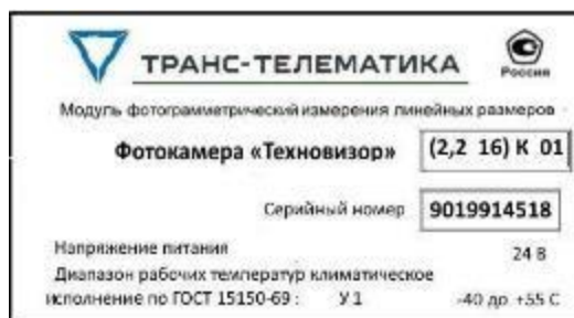
Рисунок 9 – Пример маркировочной таблички фотокамеры «Техновизор»

Заводской номер модуля «Техновизор» в виде цифрового кода наносится на маркировочные таблички (в соответствии с рисунком 7), закрепленные на корпусах напольного и постового оборудования модулей «Техновизор», с помощью сублимационной печати.