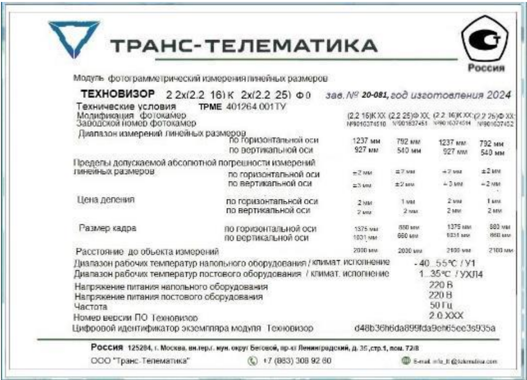
Рисунок 8 – Пример маркировочной таблички, выводимой на экран АРМ оператора и (или) АРМ метролога модуля «Техновизор»

Пример маркировочной таблички, выводимой на экран АРМ оператора и (или) АРМ метролога модуля «Техновизор» показан на рисунке 8.