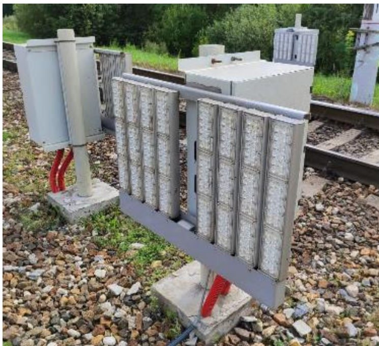
Рисунок 2 – Общий вид напольного оборудования модуля «Техновизор»

Общий вид шкафа напольного оборудования представлен на рисунке 3-5.