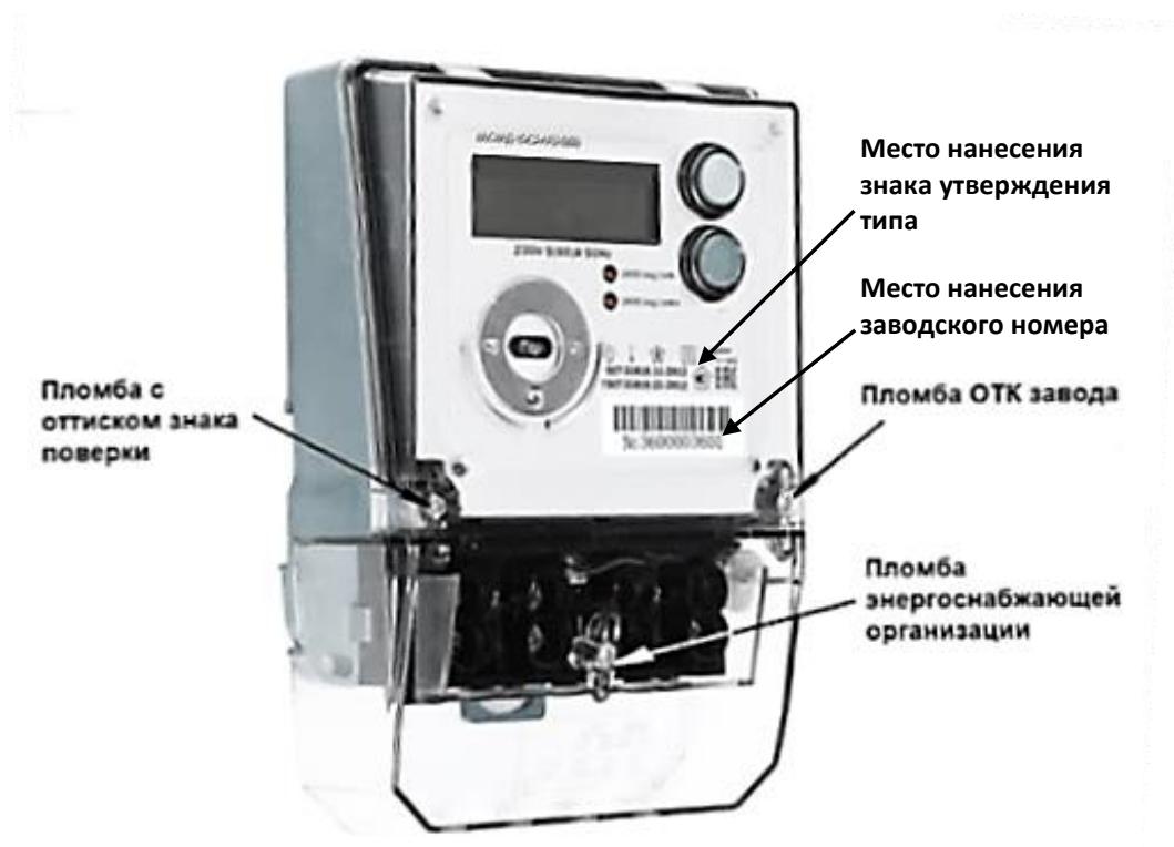
Рисунок 1 – общий вид счетчика в корпусе модификации С2