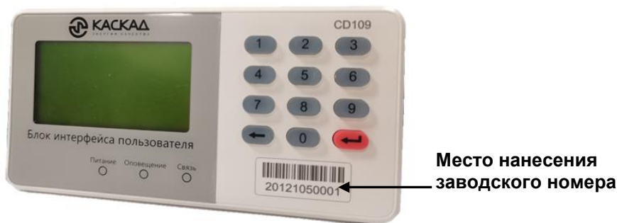
Рисунок 3 – Общий вид клиентского индикаторного устройства (КИУ).

Заводские номера, идентифицирующие каждый из счетчиков, наносятся на лицевую панель счетчика, офсетной печатью в цифровом формате (или другим способом, не ухудшающим качества).