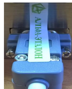
Рисунок 4 – Схема пломбировки от несанкционированного доступа, обозначение мест нанесения знака поверки