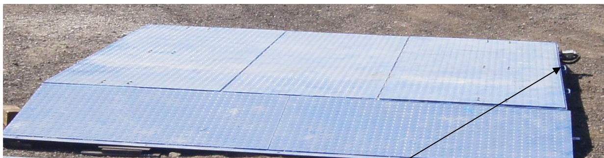
Встроенный модуль Альфа М