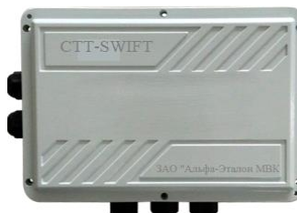
CTT-SWIFT в боксе