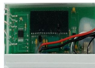
CTT-SWIFT встроенный в ГПУ весов