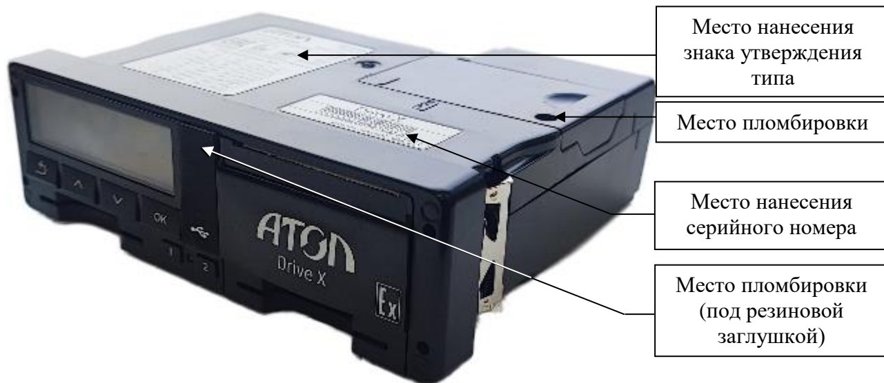
Рисунок 4 – Общий вид тахографов модификации X, выпускаемых под товарным знаком «АТОЛ»