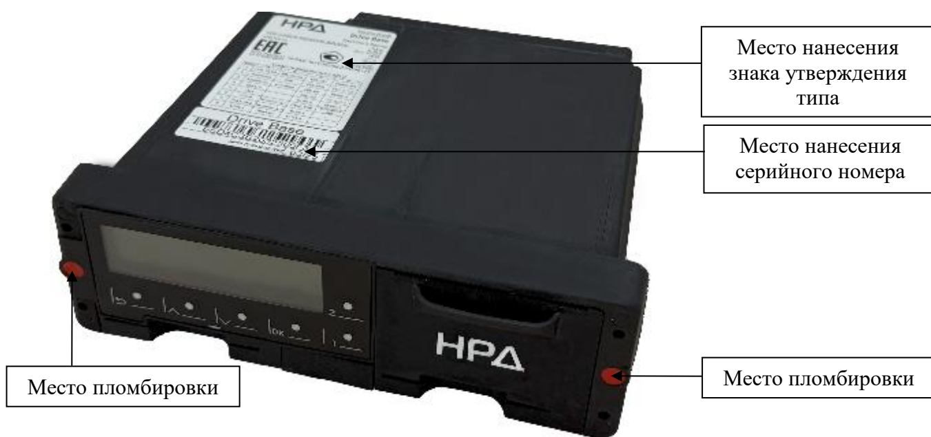
Рисунок 5 – Общий вид тахографов модификации Base, выпускаемых под товарным знаком «НРД»