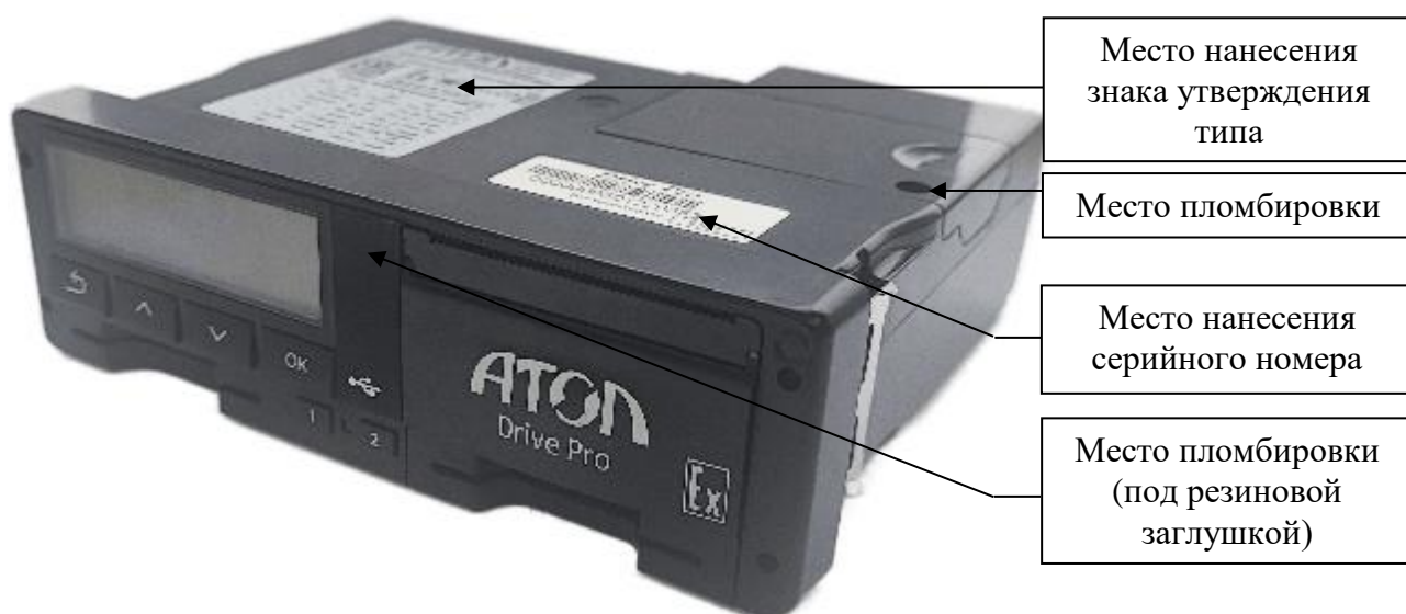
Рисунок 3 – Общий вид тахографов модификации Pro, выпускаемых под товарным знаком «АТОЛ»