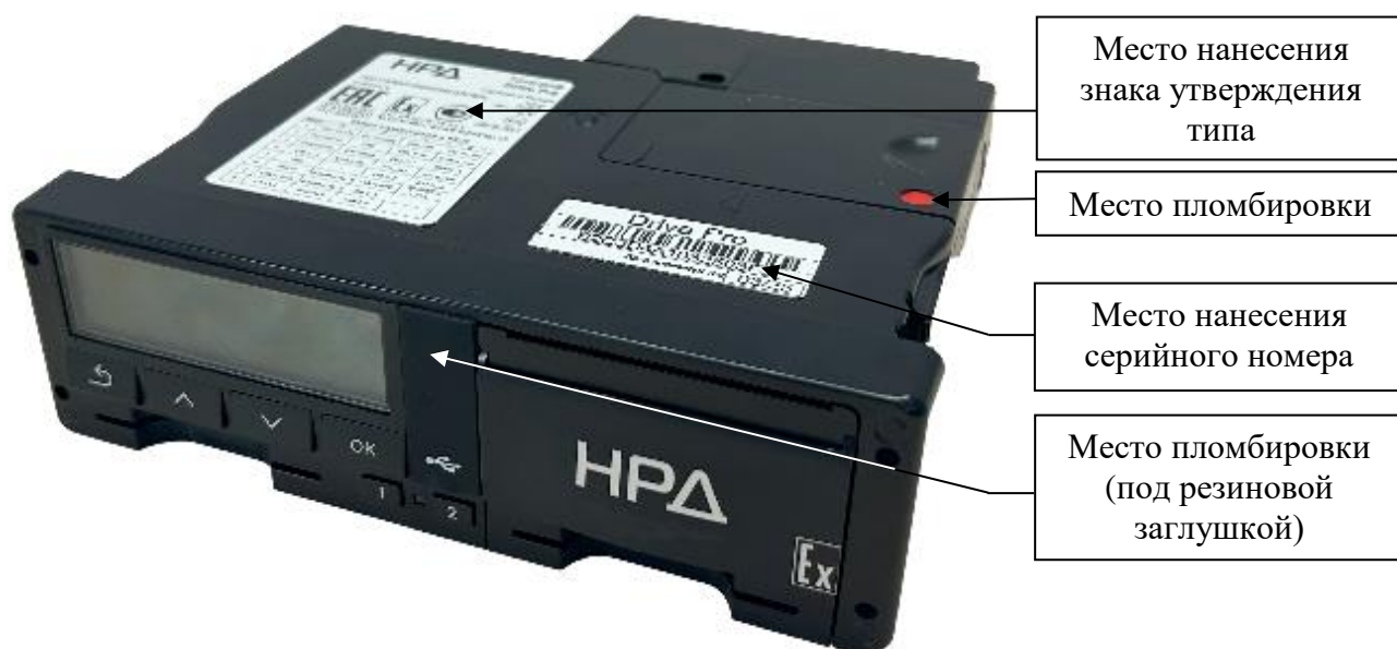
Рисунок 8 – Общий вид тахографов модификации Pro, выпускаемых под товарным знаком «НРД»