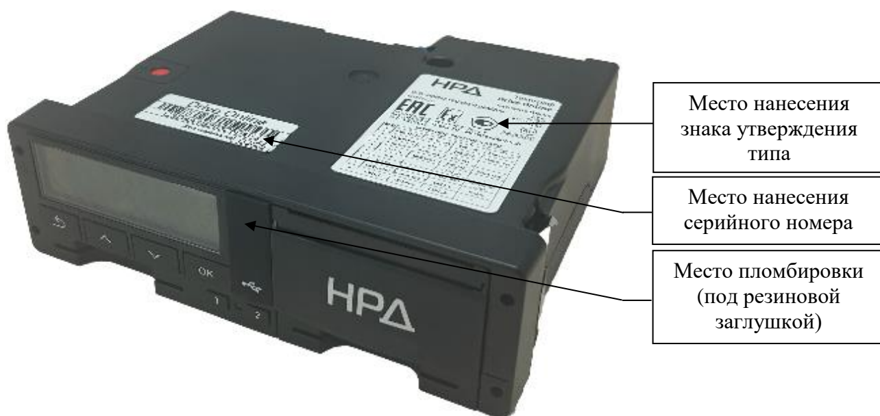
Рисунок 7 – Общий вид тахографов модификации Online, выпускаемых под товарным знаком «НРД»