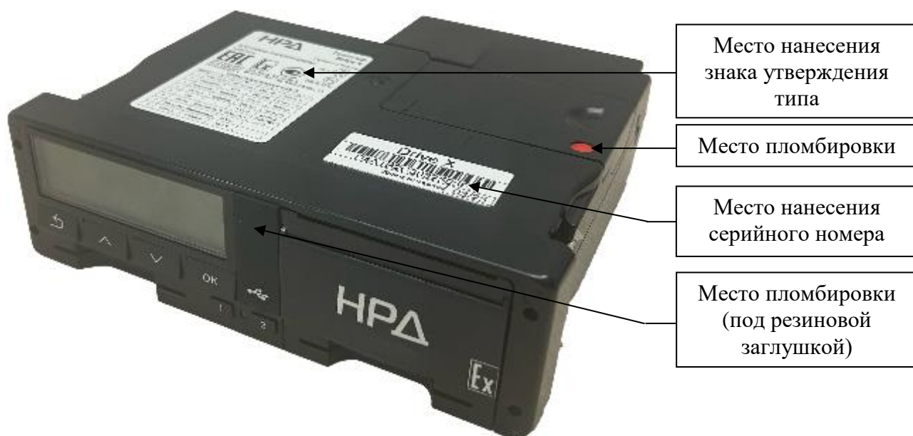
Рисунок 9 – Общий вид тахографов модификации X, выпускаемых под товарным знаком «НРД»