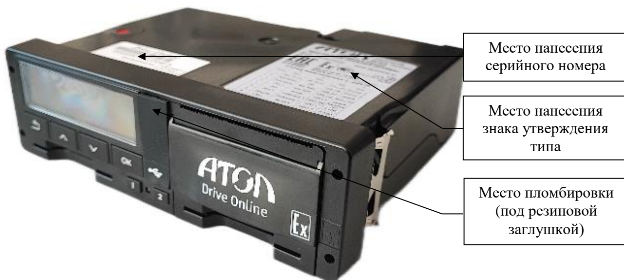
Рисунок 2 – Общий вид тахографов модификации Online, выпускаемых под товарным знаком «АТОЛ»