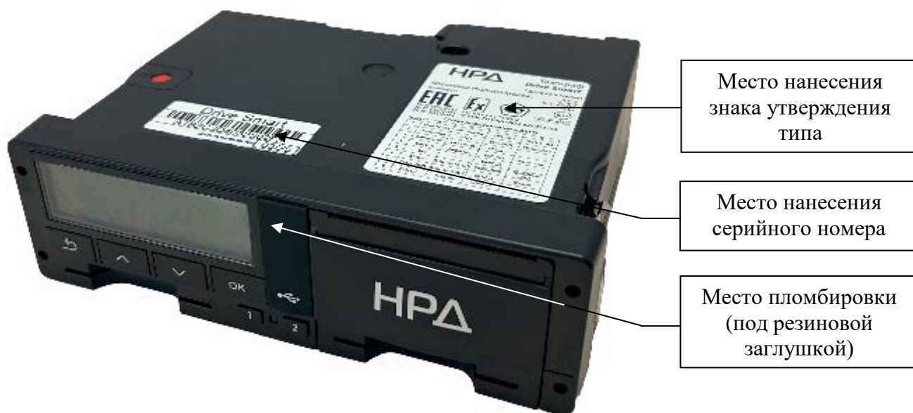
Рисунок 6 – Общий вид тахографов модификации Smart, выпускаемых под товарным знаком «НРД»