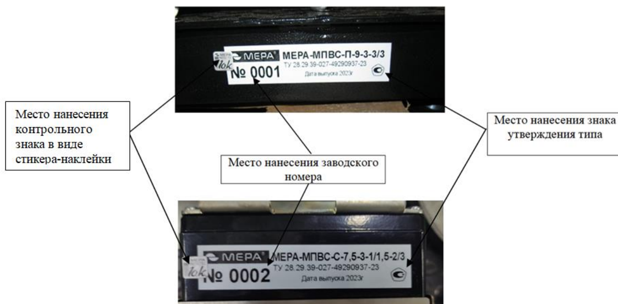
Рисунок 3 – Примеры маркировочных табличек средства измерений с указанием мест нанесения контрольного знака изготовителя в виде стикера-наклейки, мест нанесения знака утверждения типа и заводского номера

Пломбирование средства измерений при поверке не предусмотрено.