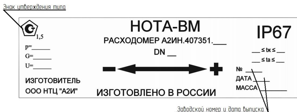
Рисунок 3 – Общий вид маркировочной таблички

Знак утверждения типа и заводской номер, состоящий из арабских цифр, наносятся несмываемой краской на маркировочную табличку, которая закреплена на корпусе расходомера.