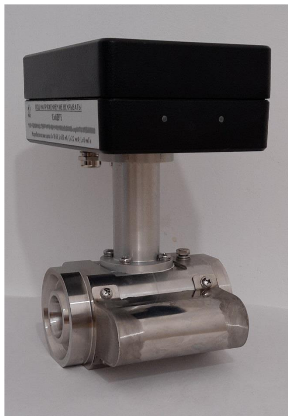
Модификация без датчика давления