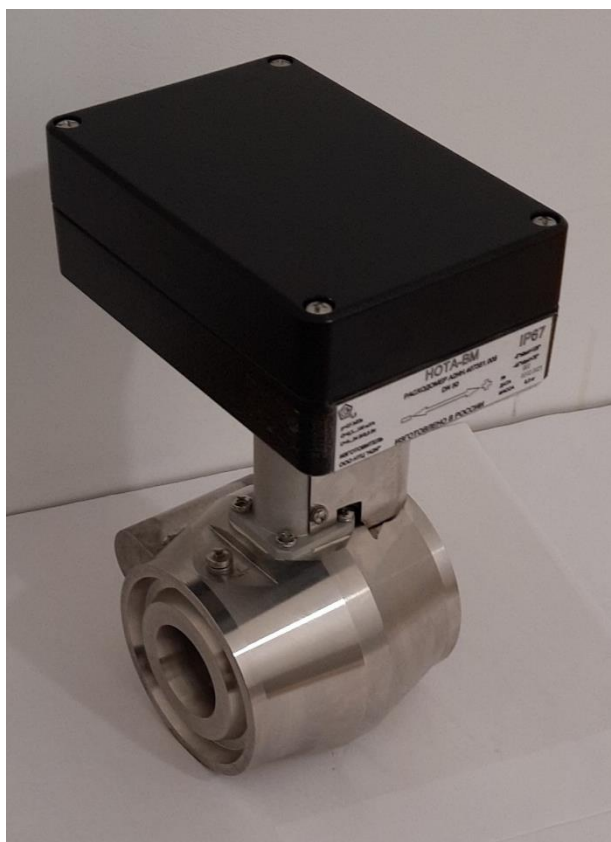
Модификация с датчиком давления

Общий вид расходомеров представлен на рисунке 1.