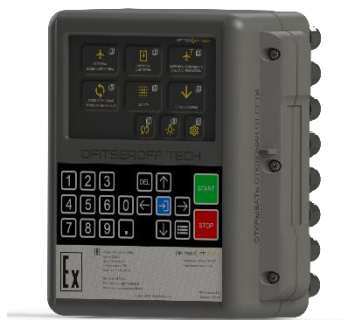
Рисунок 3 – Общий вид контроллера Atlas Master 100Ex L (202) (с функцией дозирования)