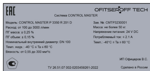
Рисунок 4 – Пример маркировочной таблички