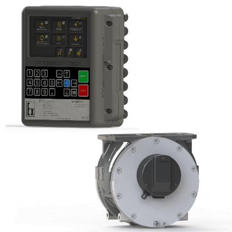
Рисунок 2 – Общий вид системы с контроллером Atlas Master 100Ex L (202) и счётчиком MCE