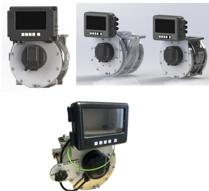
Рисунок 1 – Общий вид системы с контроллером Atlas Master 100Ex L (201) и счётчиком MCE

Общий вид системы представлен на рисунках 1 – 3, 5 – 7.