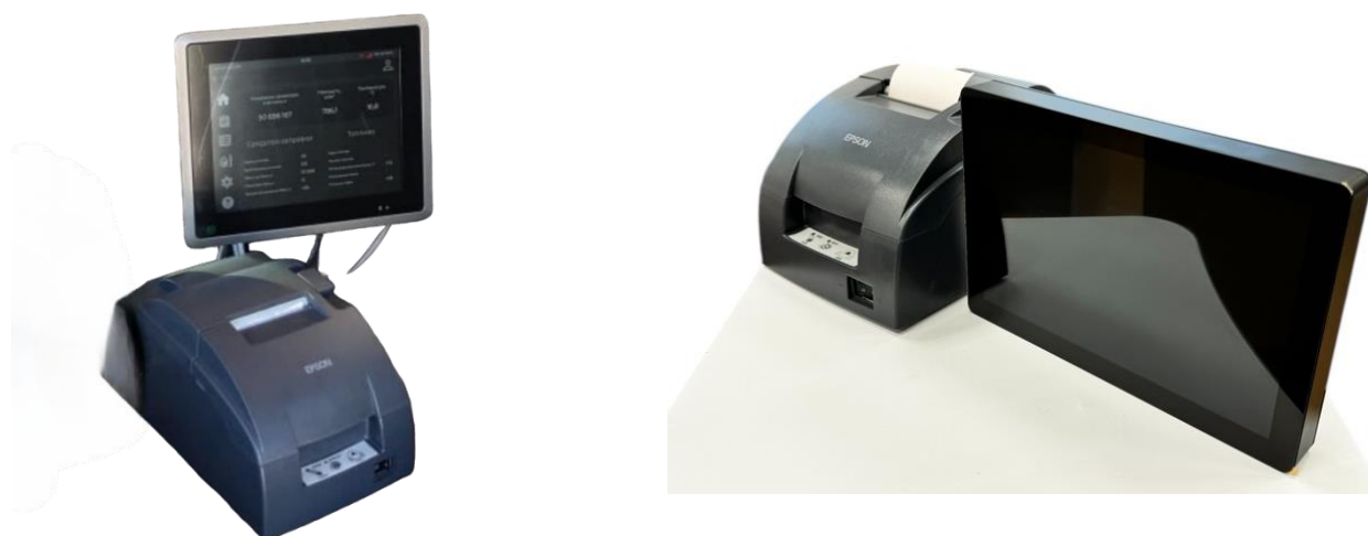
Рисунок 5 – Общий вид контроллера SFAuto