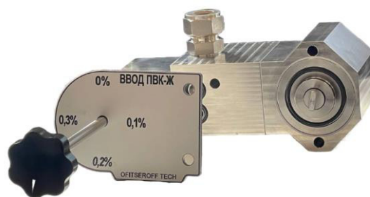
Рисунок 7 – Общий вид дозирующего поршневого насоса

Импульсный сигнал от счётчика жидкости и измерительная информация по интерфейсу RS-485 (Modbus RTU) от плотномера поступает на контроллер, на котором происходит отображение измеренной информации, вычисление массы и дальнейшая передача информации во внешние системы.