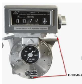
Рисунок 6 – Общий вид счётчика МКА Master