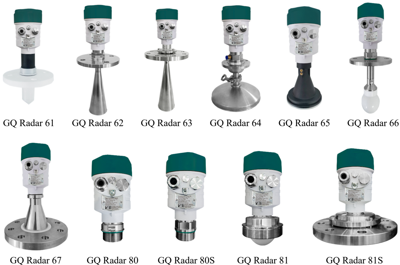
Рисунок 1 – Общий вид уровнемеров