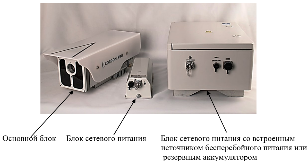
Рисунок 2 – Общий вид комплексов модификации «Кордон.Про»МД-В с блоками сетевого питания

Основные блоки комплексов изготавливаются следующих цветов: светло-серый, коричневый, светло-серый – коричневый. По заявке цвета ОБ могут быть изменены.