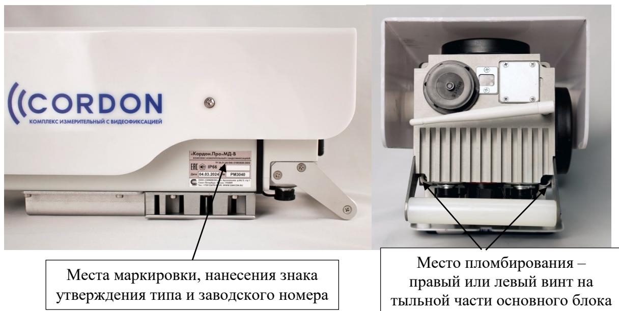
Рисунок 3 – Места пломбирования, маркировки, нанесения знака утверждения типа и заводского номера

Места пломбирования, маркировки, нанесения знака утверждения типа и заводского номера представлены на рисунке 3.