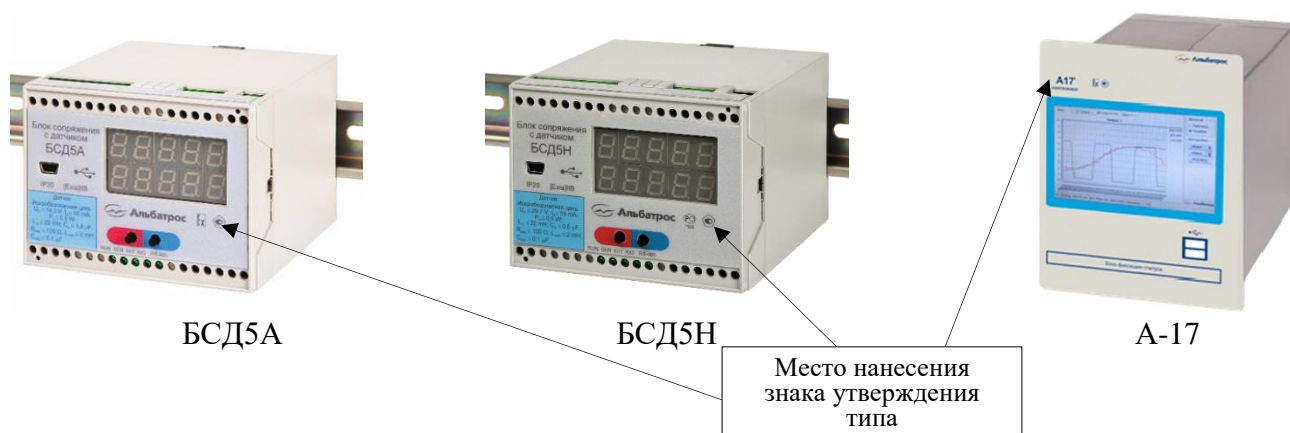
Рисунок 2 – Общий вид ВП

Заводской номер ПП в виде цифрового обозначения, состоящего из арабских цифр, наносится на корпус ПП методом лазерной гравировки. Заводской номер ВП в виде цифрового обозначения, состоящего из арабских цифр, наносится на маркировочную табличку ВП типографским способом.