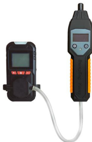
е) модификация HardGas S1 с внешним пробоотборным насосом