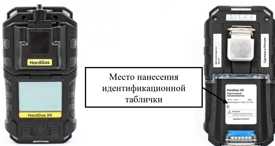
в) модификация HardGas X6