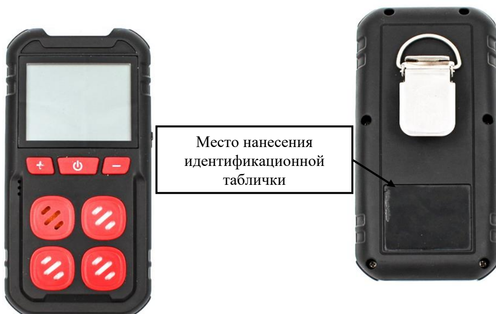
д) модификация HardGas S4