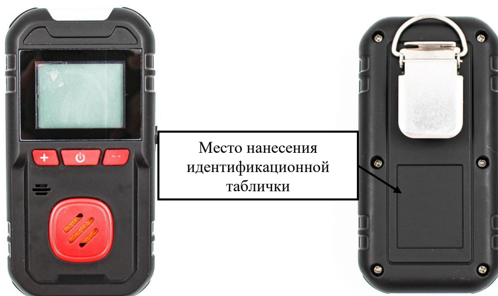
г) модификация HardGas S1