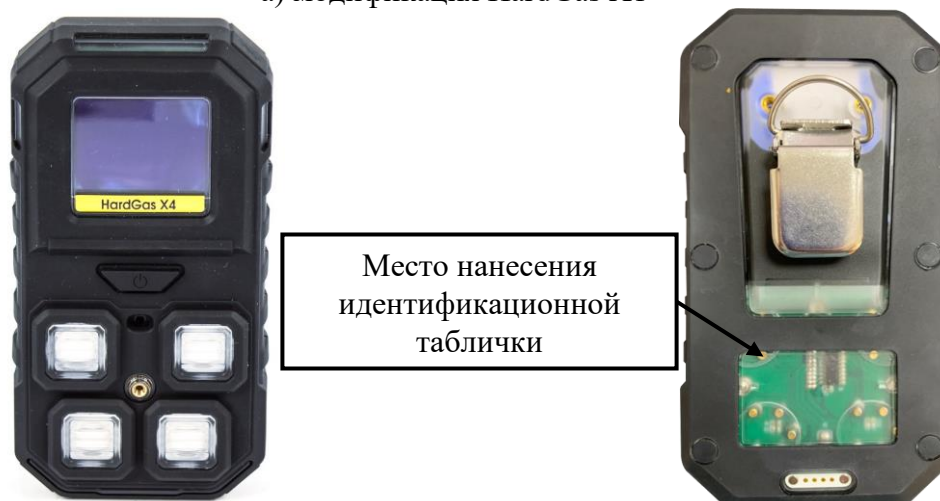
б) модификация HardGas X4