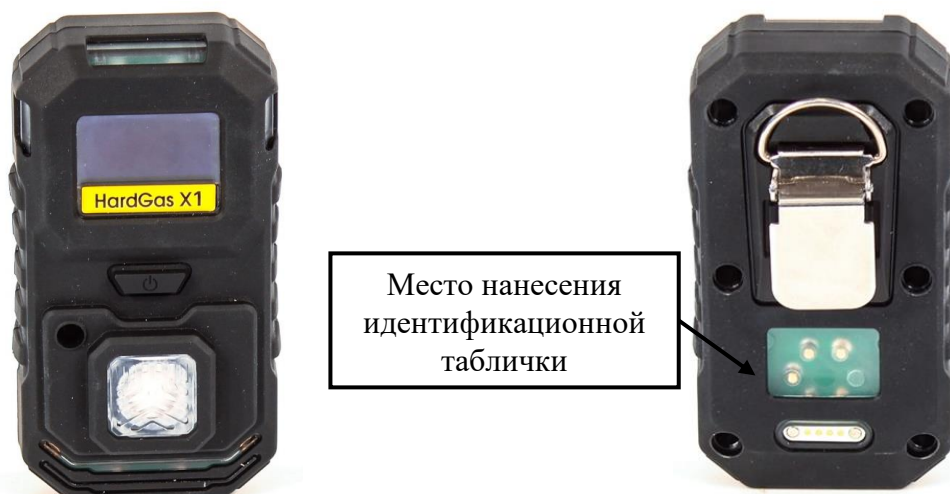
а) модификация HardGas X1