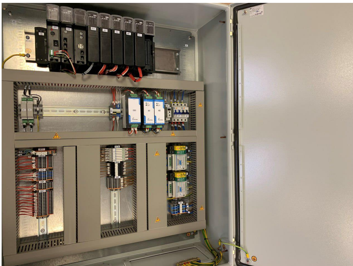
Рисунок 1 – Общий вид средства измерений с открытой передней крышкой

Общий вид средства измерений, места нанесения заводского номера и знака утверждения типа представлены на рисунках 1, 2. Количество модулей, размещённых внутри, может отличаться в зависимости от модификации.