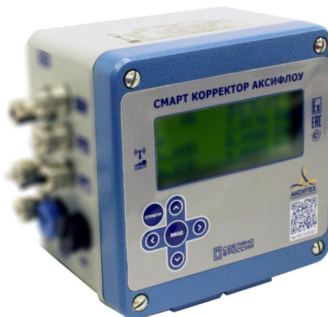
Рисунок 1 – Общий вид смарт корректора АКСИФЛОУ

На рисунке 1 приведен общий вид смарт корректора АКСИФЛОУ.