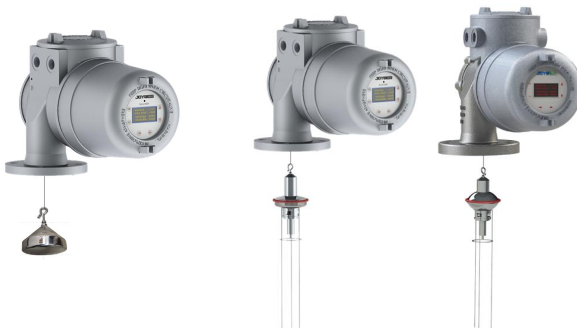
BJLM-80H с буйком для измерения уровня