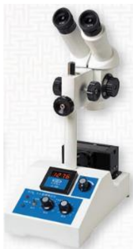
Рисунок 1д – MP2B