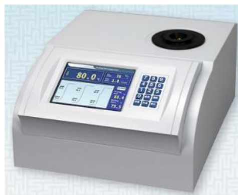
Рисунок 1г – MP4, MP4S, MP5S с кнопочной клавиатурой