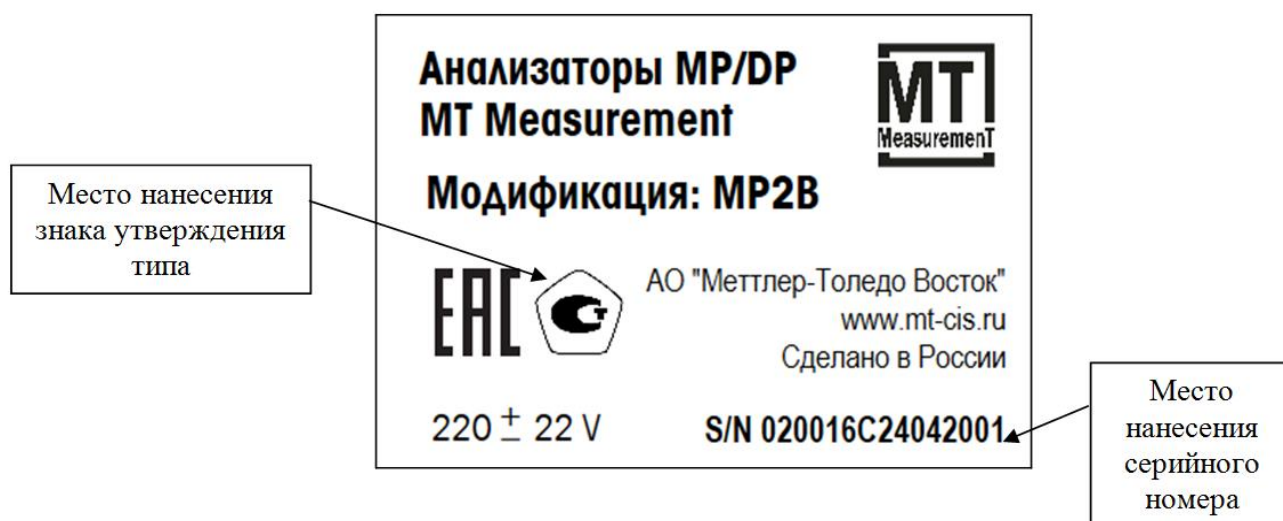
Рисунок 2 – Место нанесения серийного номера и знака утверждения типа

Пломбирование средства измерений не предусмотрено.