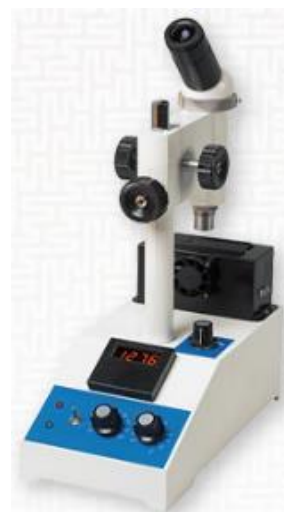
Рисунок 1е – MP2M, MP1M