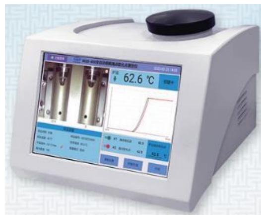
Рисунок 1б – DP9, DP8C