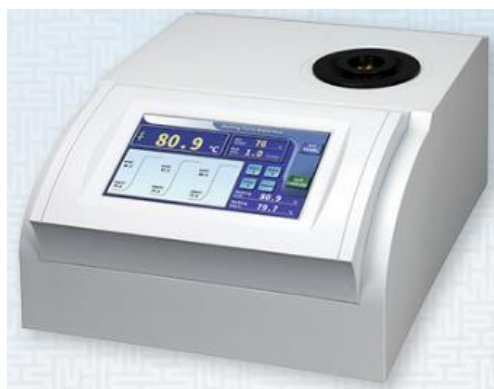
Рисунок 1в – MP7S, MP6, MP4, MP4S, MP5S с тактильной клавиатурой