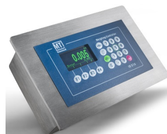
Весовой терминал ID510