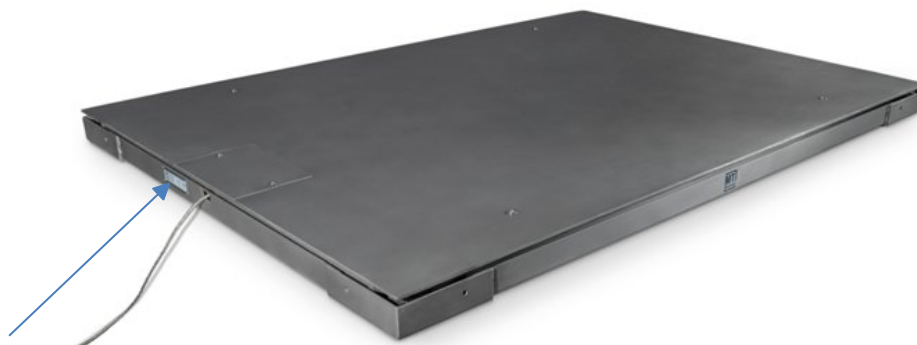
Рисунок 7 – Место нанесения маркировочной таблички со знаком утверждения типа и заводским номером на раму весов

Пломбирование весов осуществляет изготовитель при максимальной нагрузке весов до 300 кг. Весы с максимальной нагрузкой более 300 кг поверяются после пусконаладки на месте эксплуатации аккредитованной на поверку лабораторией, которая принимает весы.