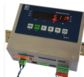
Весовой терминал ID511