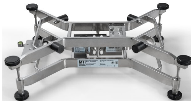
Рисунок 6 – Место нанесение маркировочной таблички со знаком утверждения типа и заводским номером на раму весов под грузоприемную крышку

Заводской номер в буквенно-цифровом формате и знак утверждения типа наносится на маркировочную табличку, которая наклеивается на раму под грузоприемную крышку или сбоку на раму весов, как показано на рисунках 6 и 7.