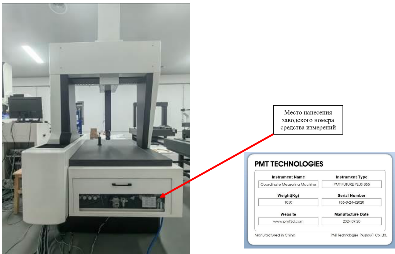
Рисунок 2 – Место нанесения заводского номера средства измерений