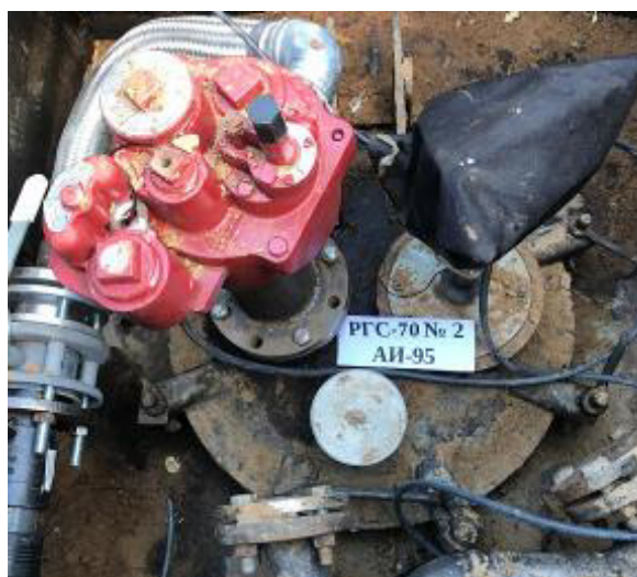
Рисунок 3 – Горловина резервуара РГС-70 зав.№ 2