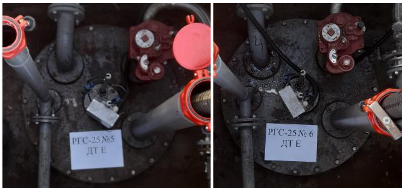
Рисунок 4 – Горловины резервуаров РГС-25 зав.№№ 5, 6

Пломбирование резервуаров РГС-25 не предусмотрено.