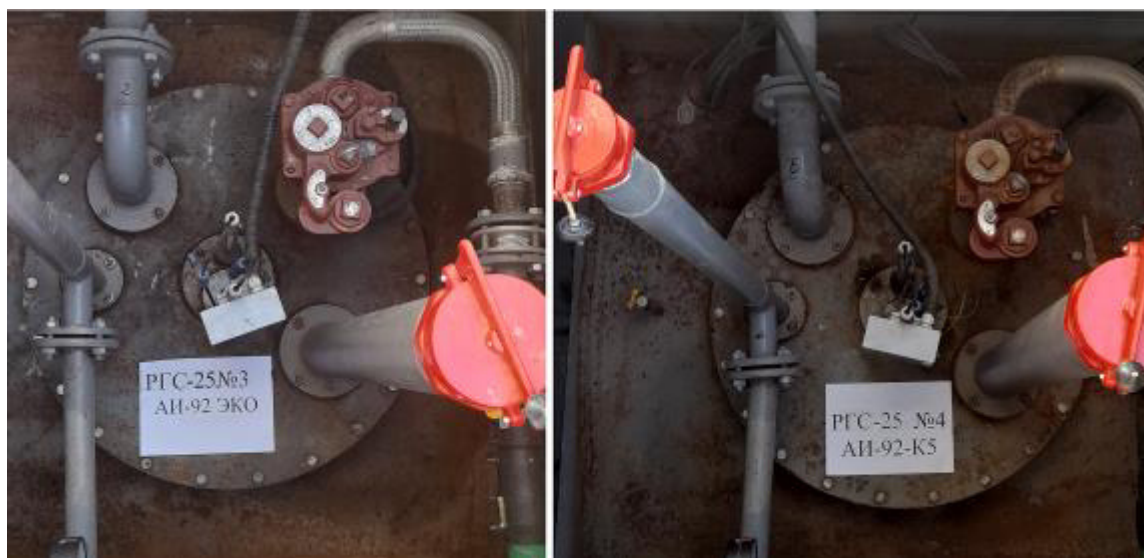
Рисунок 3 – Горловины резервуаров РГС-25 зав.№№ 3, 4