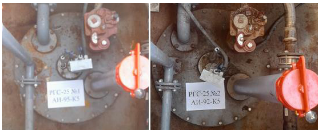
Рисунок 2 – Горловины резервуаров РГС-25 зав.№№ 1, 2