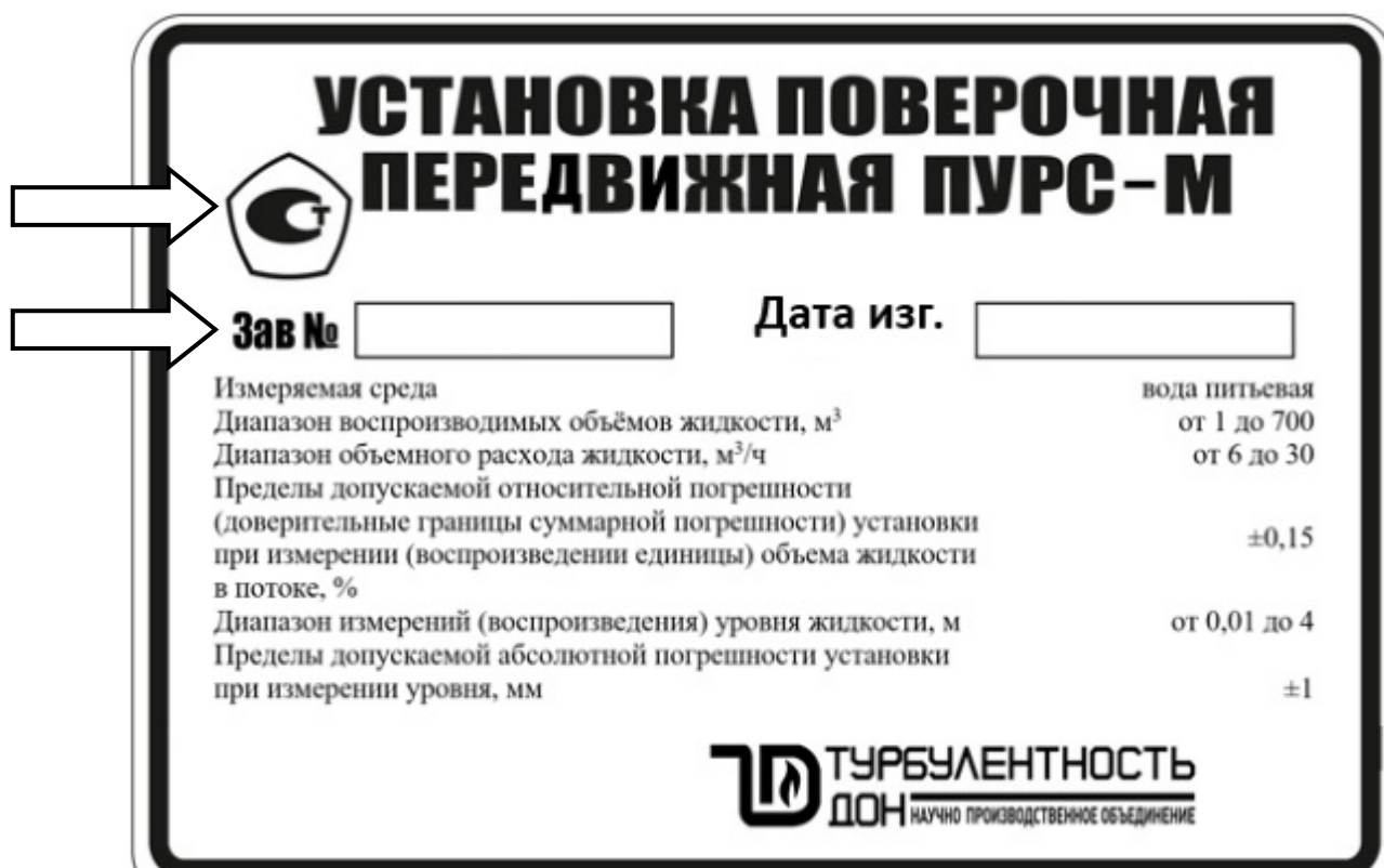
Рисунок 3 – Обозначения мест нанесения знака утверждения типа и заводского номера

Обозначения мест нанесения знака утверждения типа и заводского номера представлены на рисунке 3