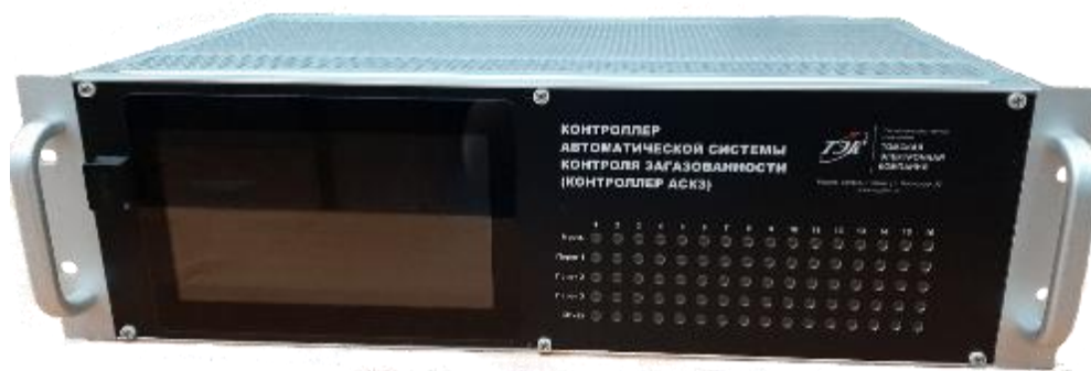
Рисунок 2 – Общий вид контроллеров АСКЗ (лицевая панель)