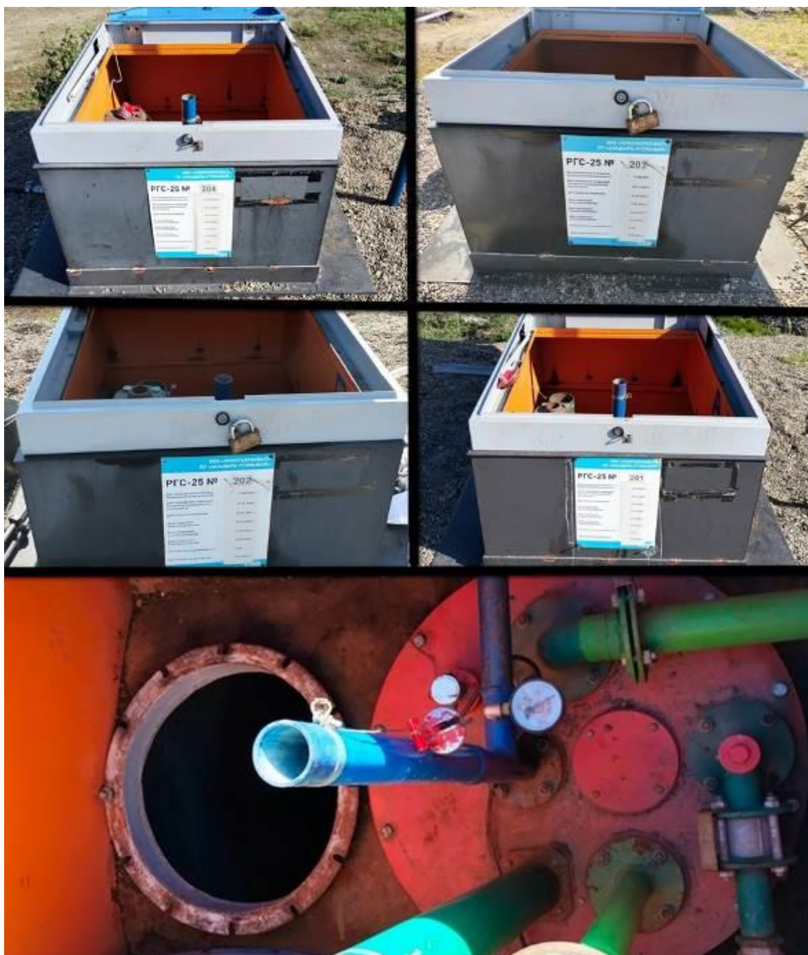
Рисунок 1 – Фотография общего вида горловин и заводских номеров резервуара РГС-25