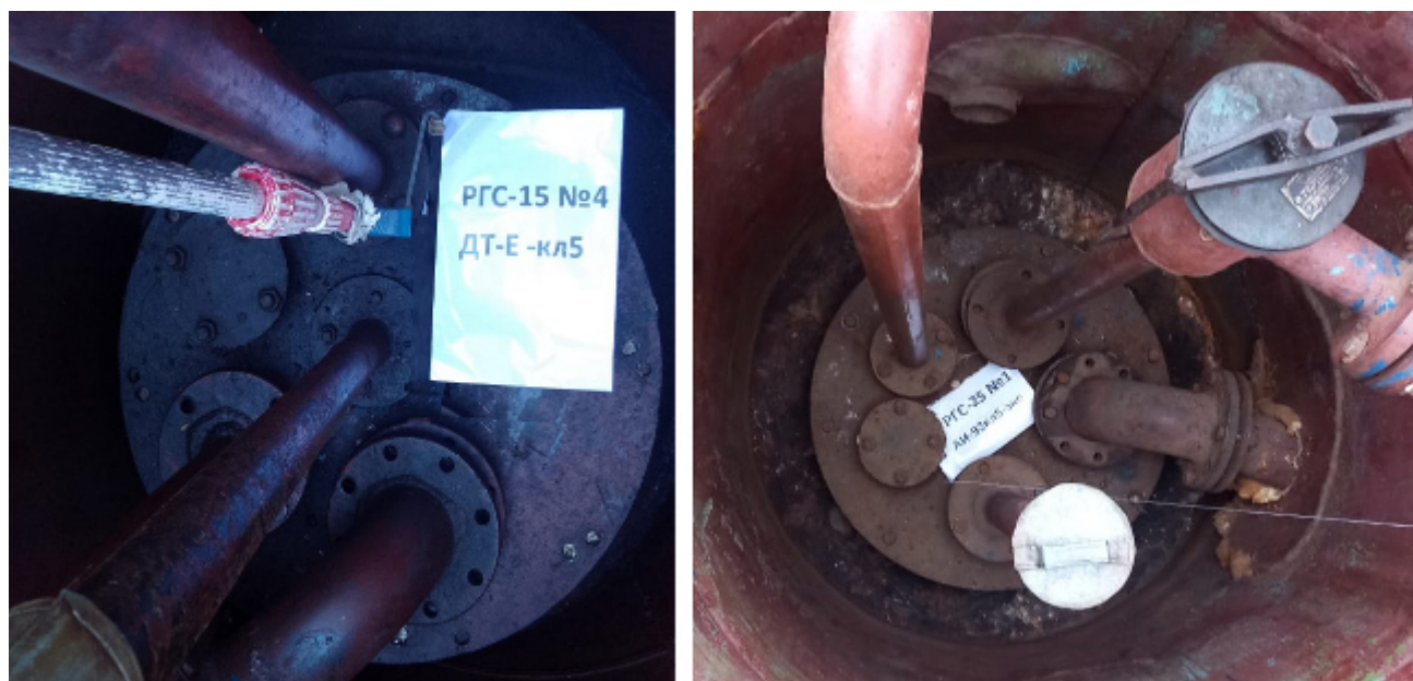
Рисунок 3 – Горловины резервуаров РГС-15 зав.№ 4, РГС-25 зав.№ 1