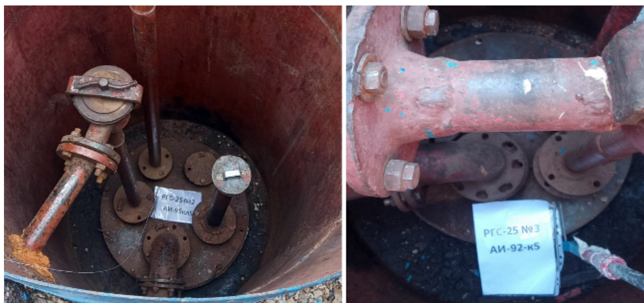
Рисунок 4 – Горловины резервуаров РГС-25 зав.№№ 2, 3

Пломбирование резервуаров РГС не предусмотрено.