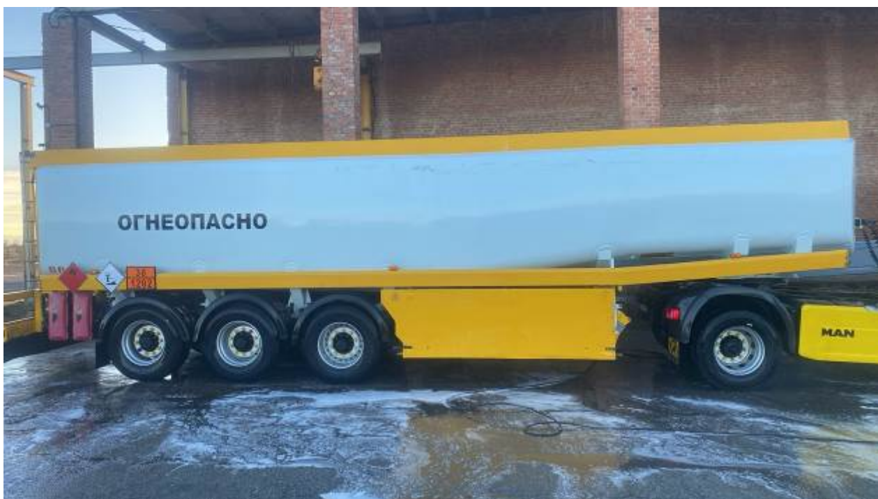
Рисунок 1 – Общий вид полуприцепа-цистерны AUREPA TSA 400 LDK