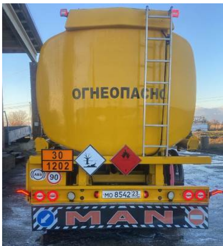
Рисунок 2 – Общий вид полуприцепа-цистерны AUREPA TSA 400 LDK

Схема пломбировки для защиты от несанкционированного изменения положения уровня налива, обозначение места нанесения знака поверки представлены на рисунке 3.