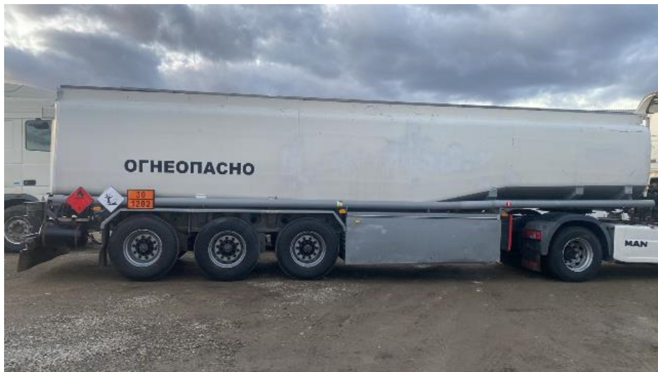
Рисунок 1 – Общий вид полуприцепа-цистерны STRUEVER

Схема пломбировки для защиты от несанкционированного изменения положения уровня налива, обозначение места нанесения знака поверки представлены на рисунке 2.