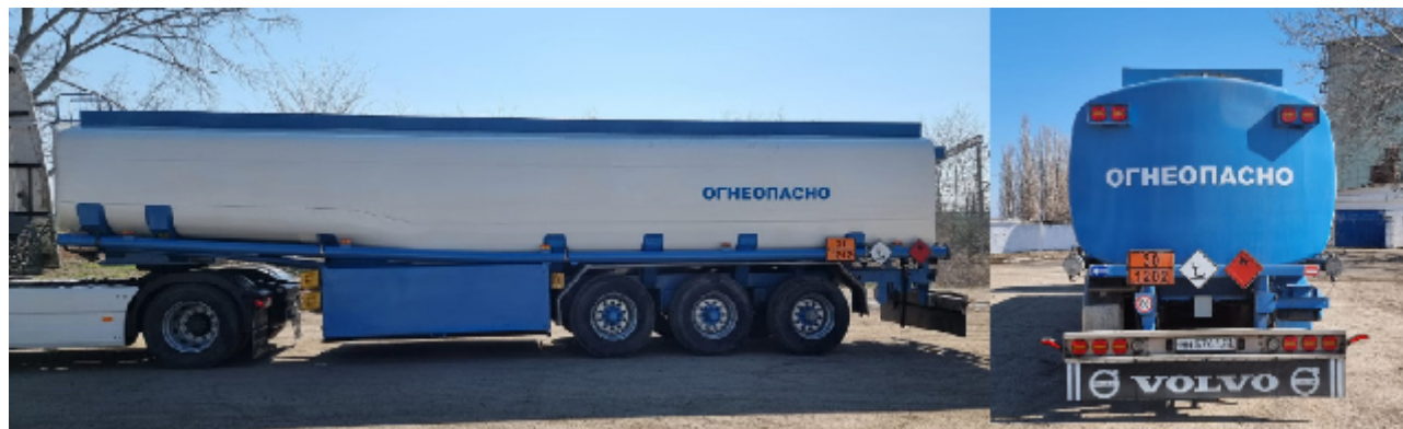
Рисунок 1 – Общий вид ППЦ ROHR STB 41/10-24

Общий вид ППЦ ROHR STB 41/10-24 зав.№ W09696000S3R12036 представлен на рисунке 1.