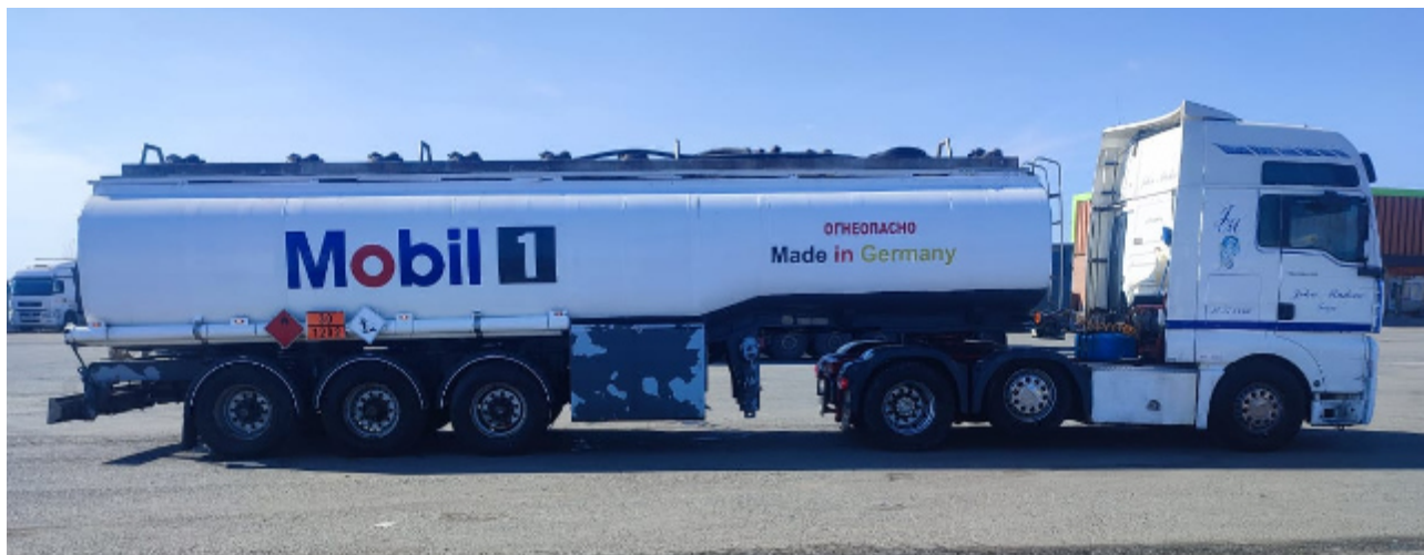
Рисунок 1 – Общий вид полуприцепа-цистерны BOLGAN BB38