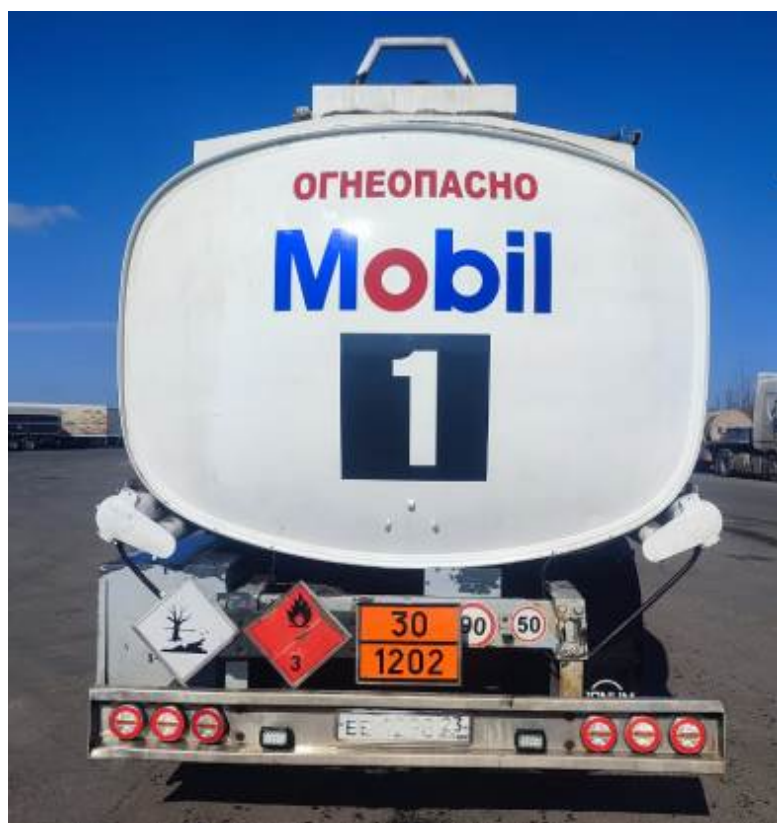
Рисунок 2 – Общий вид полуприцепа-цистерны BOLGAN BB38

Схема пломбировки для защиты от несанкционированного изменения положения уровня налива, обозначение места нанесения знака поверки представлены на рисунке 3.