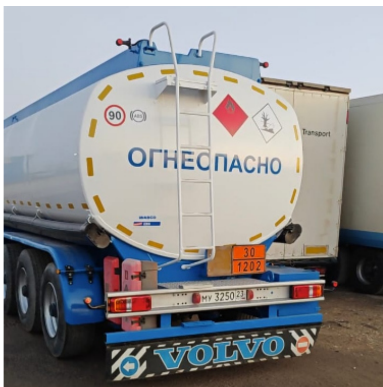
Рисунок 2 – Общий вид полуприцепа-цистерны CRANE FRUEHAUF