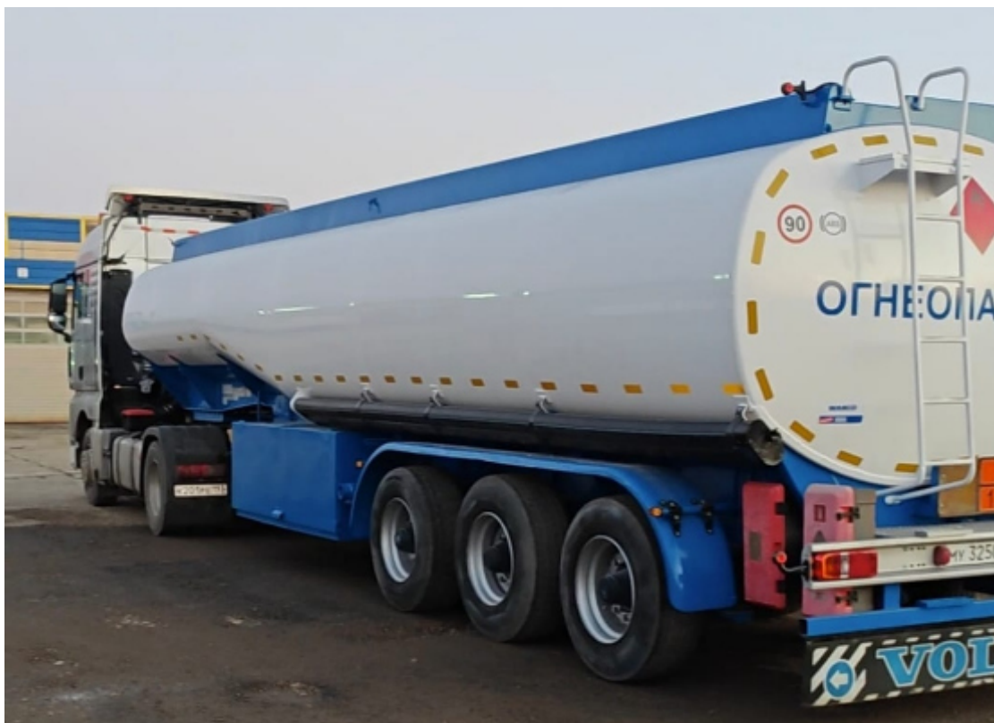
Рисунок 1 – Общий вид полуприцепа-цистерны CRANE FRUEHAUF