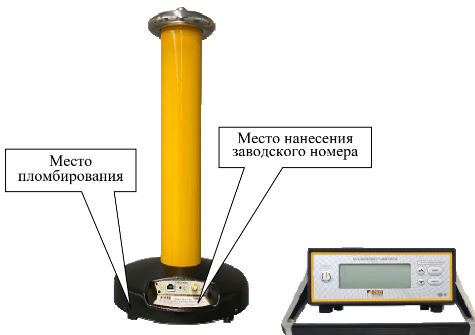
Рисунок 2 – Общий вид киловольтметров цифровых КВЦ модификаций КВЦ-70В-1,0; КВЦ-70В-0,5; КВЦ-100В-1,0; КВЦ-100В-0,5; КВЦ-120В-1,0; КВЦ-120В-0,5 с указанием мест пломбировки от несанкционированного доступа, мест нанесения заводского номер