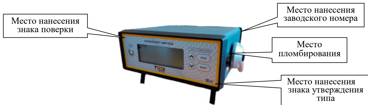
Рисунок 1 – Общий вид киловольтметров цифровых КВЦ модификаций КВЦ-10В-0,5; КВЦ-10В-0,25; КВЦ-10С-0,25 с указанием мест пломбировки от несанкционированного доступа, мест нанесения заводского номера, знака поверки и знака утверждения типа