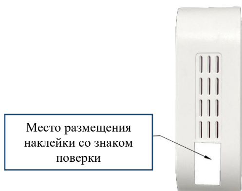
Рисунок 2 – Вид сигнализаторов загазованности ГТР-1 сбоку