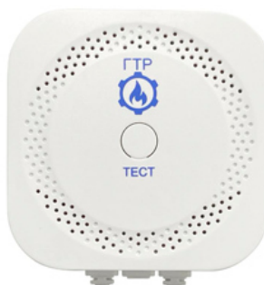
б) Вид сигнализатора загазованности ГТР-1 спереди