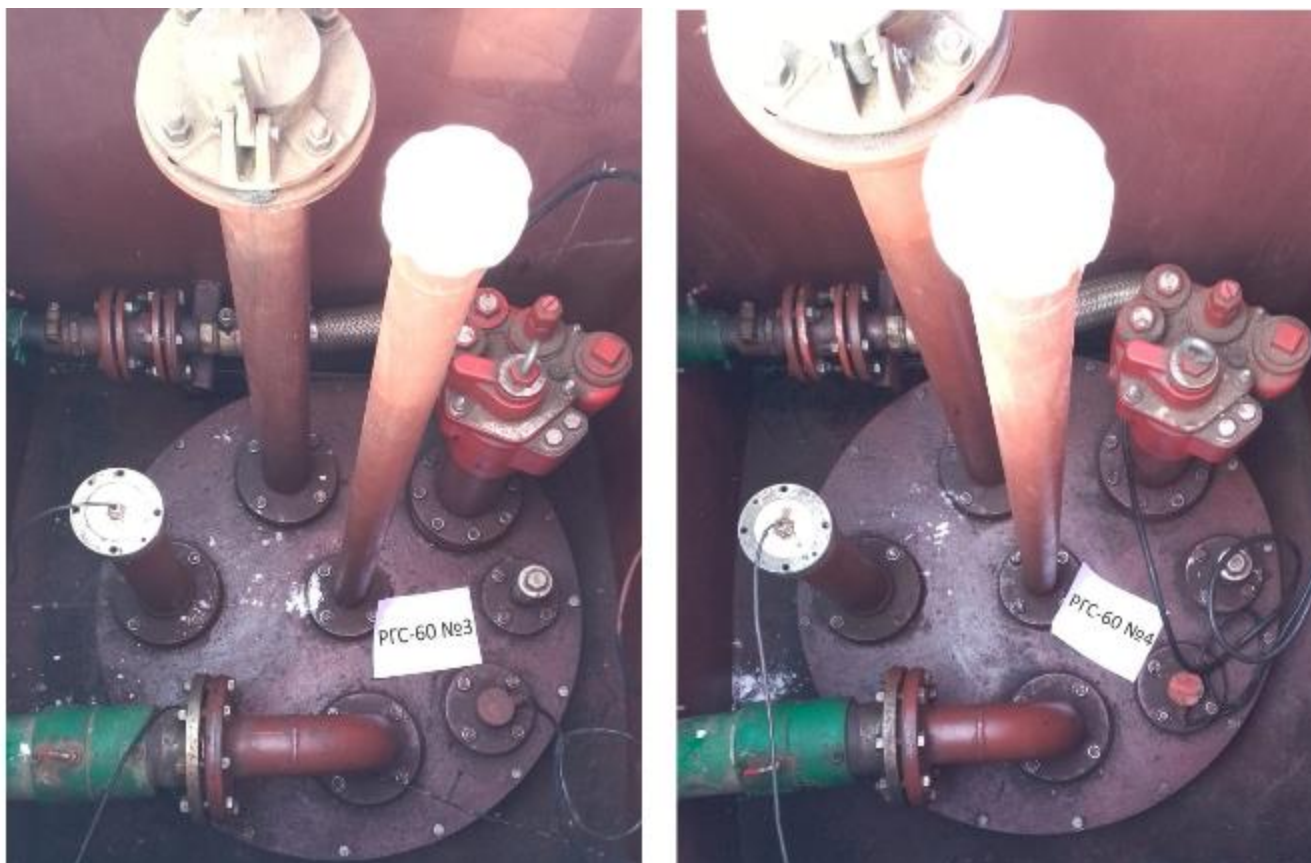
Рисунок 3 – Горловины резервуаров РГС-60 зав.№№ 3, 4

Пломбирование резервуаров РГС-60 не предусмотрено.