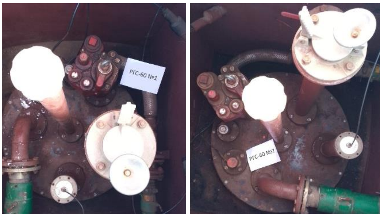
Рисунок 2 – Горловины резервуаров РГС-60 зав.№№ 1, 2