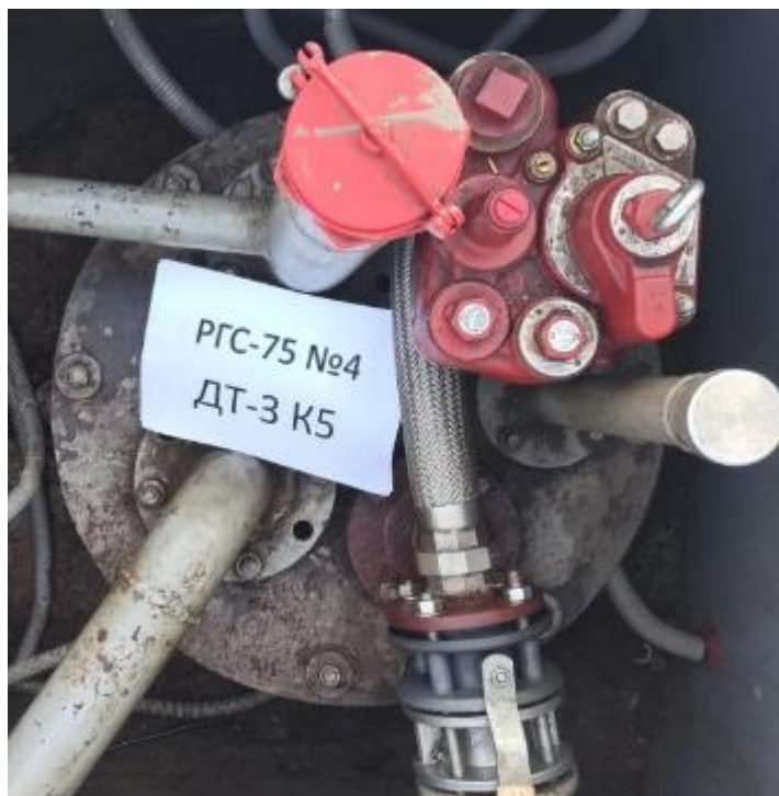
Рисунок 4 – Горловина резервуара РГС-75 зав.№ 4

Пломбирование резервуаров РГС не предусмотрено.