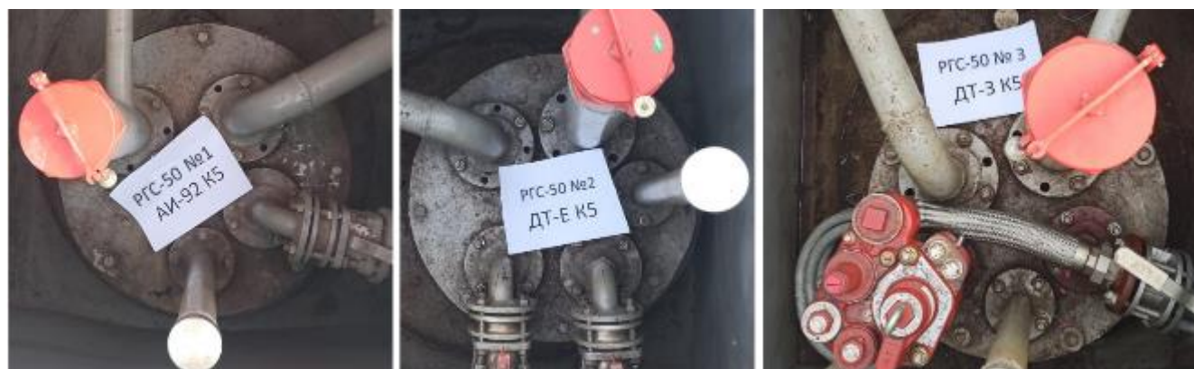
Рисунок 3 – Горловины резервуаров РГС-50 зав.№№ 1, 2, 3