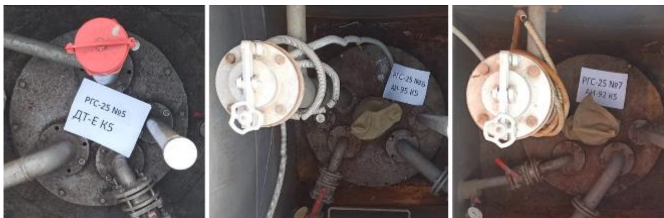
Рисунок 2 – Горловины резервуаров РГС-25 зав.№№ 5, 6, 7